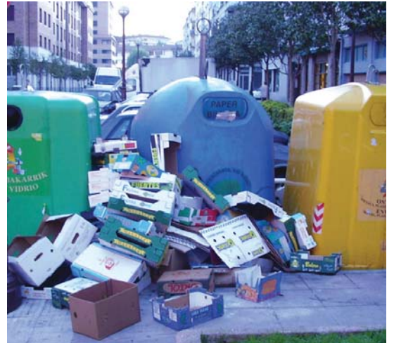
Inkesta bidez, lasarteoriatarrek hondakin kudeaketa nola egiten duten jakingo da.