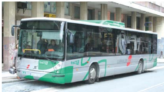
Auzo elkarteek lau urte daramatzate, ospital gunerako autobusa eskatzen.

"Garraioari dagokionez, lau urte daramatzagu horrekin eta oraindik gauzak konpontzeko daudela esan digu Iñakik. Eta, gainera, ospitalera autobusa jartzeari zail ikusten duela. Gero eta lasarteoriatar gehiago doa ospitalera, langileak edo kanpo kon-