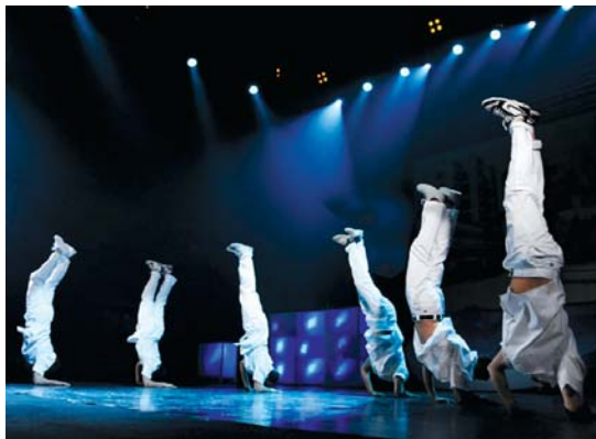
Breakdance-a eta hip hop-a izango dira gaur nagusi Kultur etxeko aretoan.