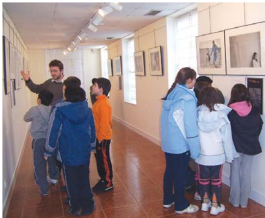
Besteak beste, Landaberri ikastolako gaztetxoak izan ziren erakusketa bisitatzen.