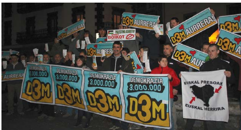
Ezker abertzalekoek ekonomia eta politika krisia gainditzeko D3Mren urrezko botoetan inbertitzeko eskatu dute.