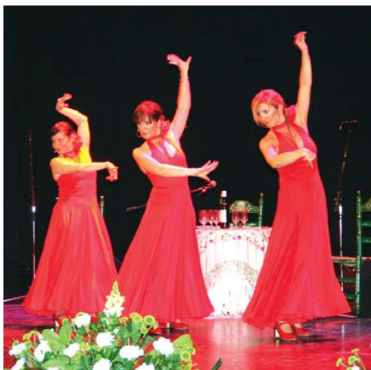
Zambra dantza taldeak emanaldi paregabea eskaini zuen iazko Andaluzia egunean.

Semblante Andaluzek antolatutako ospakizunetako ekitaldi nagusiak Andaluzia