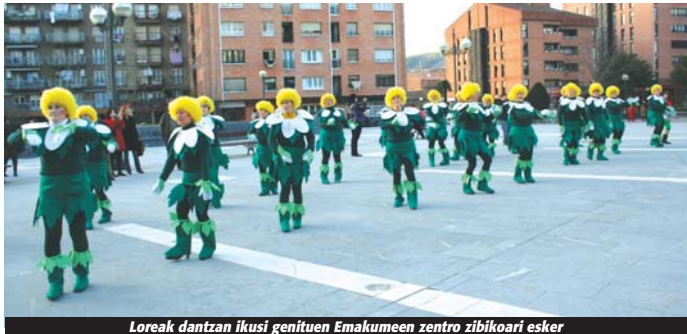
Loreak dantzan ikusi genituen Emakumeen zentro zibikoari esker