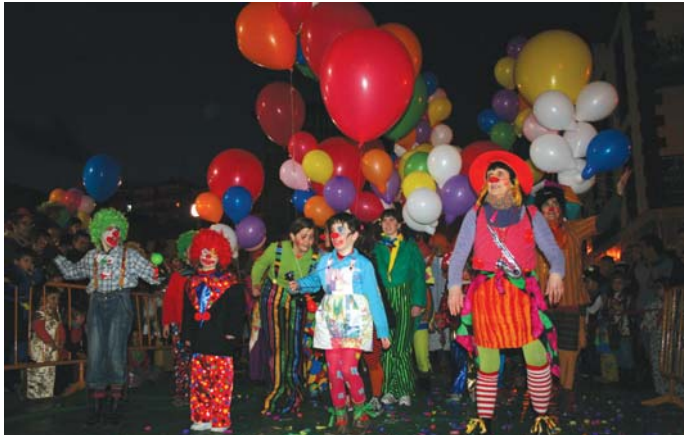
Zabaletako klownek zirko mundiala alaitu eta Epoitaitaie abestiarekin guztiok dantzan jarri gintuzten