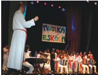
San Ferminen parodia Musika eskolako kontzertuan