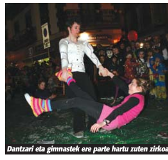
Dantzari eta gimnastek ere parte hartu zuten zirkoan