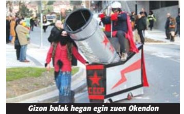
Gizon balak hegan egin zuen Okendon