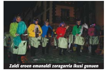
Zaldi eroen emanaldi zoragarria ikusi genuen