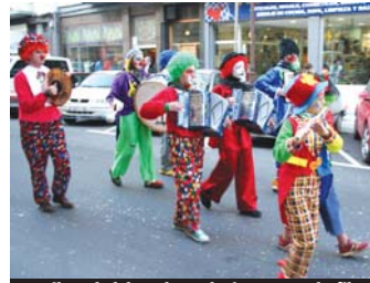
Musika eskolako orkestrak girotu zuen desfilea