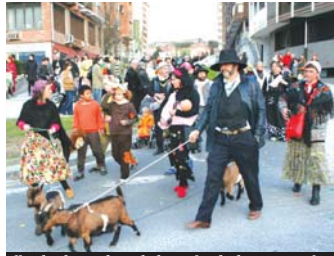
Jitoak, ahuntzak, tonbola eta igarleak ere egon ziren