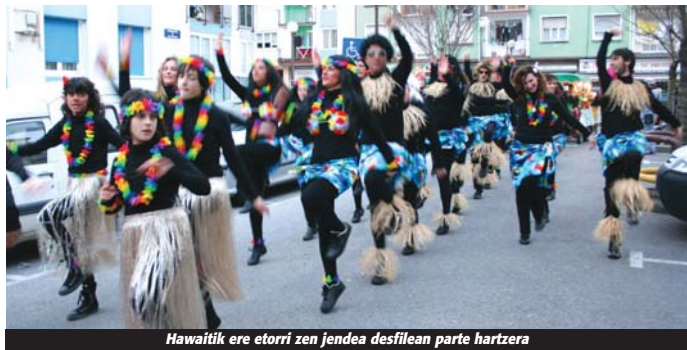
Hawaiitik ere etorri zen jendea desfilean parte hartzera