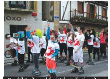
Kuadrilategiko malabaristak ere ikusi genituen