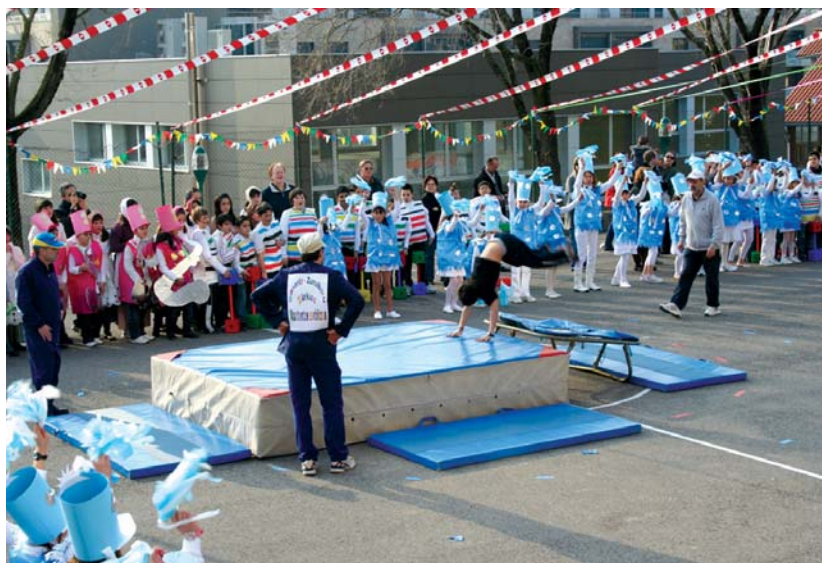
Goiko argazkia Sasoeta-Zumaburu ikastetxeko jaialdikoa; behekoa eta ezkerrekoa berriz, Landaberrri ikastolakoa.

Hau guztia, zenbaki honetako zentraletan ikusi dezakezue. •