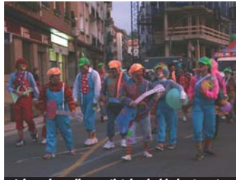
Jalguneko pailazo artistek ederki abestu zuten