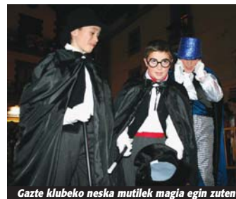
Gazte klubeko neska mutilek magia egin zuten