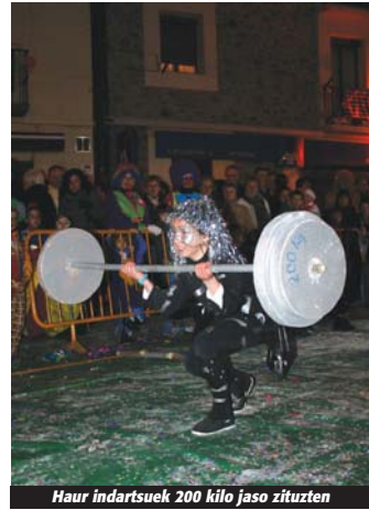
Haur indartsuek 200 kilo jaso zituzten