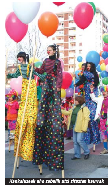
Hankaluzeek aho zabalik utzi zituzten haurrak