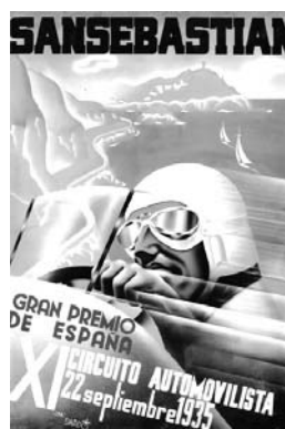
1923an Automobil Aste Handia iragarri zuen kartela eta hurrengo urteetan erabilitako beste hainbat.

hori. Orain bezala zirkuitu bati behin eta berriz bueltak aritu beharrean, ordea, parte-hartzaileak Lasarte eta inguruetakogune ugaritik igarotzen ziren,