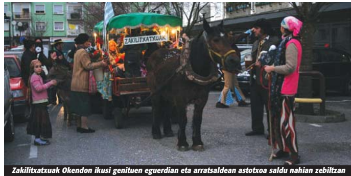
Zakiltzatxoak Okendon ikusi genituen eguerdian eta arratsaldean astotxoak saldu nahian zebiltzan