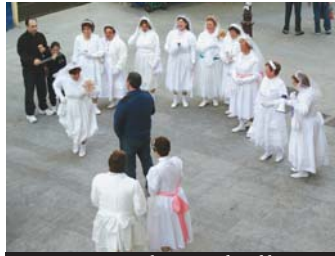
Jaunartzea egin zuen neska taldea