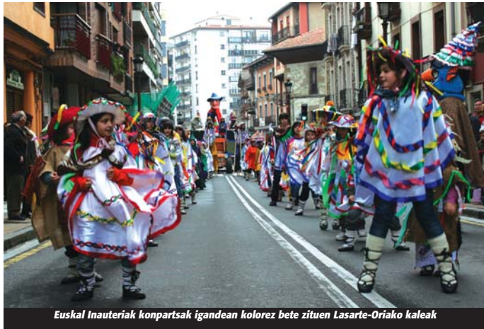
Euskal Inauteriak konpartsak igandean kolorez bete zituen Lasarte-Oriako kaleak