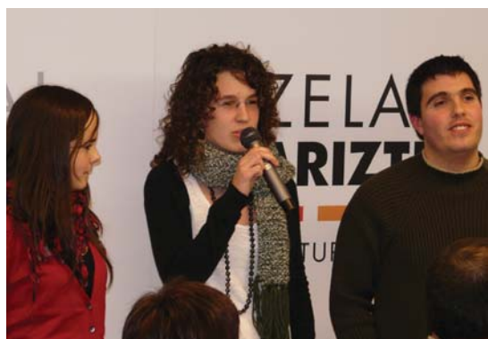
Iturriotz, Labaka eta Legorburu saridunek bertso bana abestu zuten.