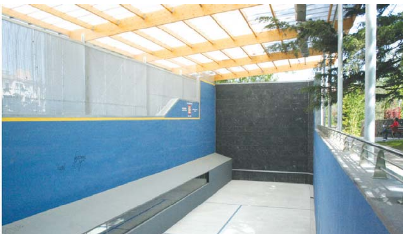
Mirentxu Etxeko trinketa doan erabili daiteke, libre dagoenean, 15 minutu lehenago eskatuta.

Bukatzean, energiak berreskuratzeko Euskal Giroa elkarteak prestatutako salda beroa eta txorizoa dago parte-hartzaileentzat. Gainera, nahiz eta saririk ez eskuratu, inor ez da esku hutsik joaten etxera, kamisetak banatzen baitituzte guztientzat. •