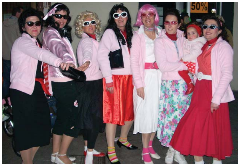
Aurten ere era guztietako mozorroak jantziko dituzte Lasarte-Oriako haur eta helduek.