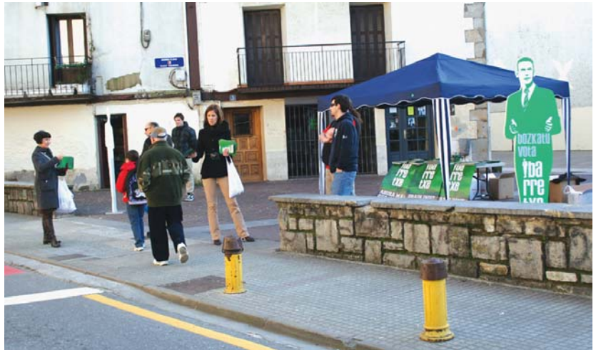
EAJ-PNV alderdiko kideak astearte arratsaldean Okendo plazan egon ziren propaganda, gozokiak eta globoak banatzen.

Gainera, ezker abertzaleko alderdiek «zuzenean edo zeharka edozein hauteskunde ekitaldi, deialdi edo prentsaurreko» egitea debekatuta dutela eta agindua betetzen ez duenari desobediencia egotziko zaiola ohartarazi du. •