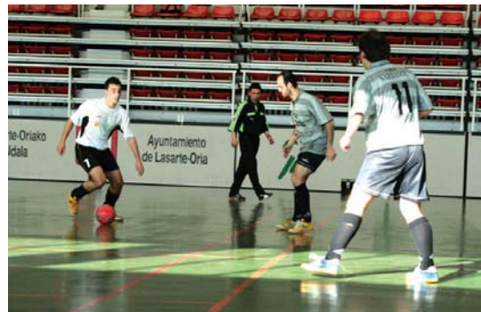
Irudian, Aldaz Buenetxearen aurkako partidari.

Hala ere, Aldaz H. K. taldeko mutilek sailkapeneko lehenengo postua berriro ere eskuratzeko aukera dute igan-