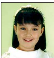
Ane Bego Zorionak eta 13 muxu handi famili guztiaren partetik.