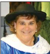
Mailu Zorionak guapa! Adin horrekin eta horrela habili! Eta eskerrak! Ez aldatu, berdin segi!