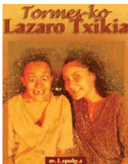
Asteburuan kultur etxean izango diren emanaldien kartel bana.

Igandean, berriz, Lepel filma izango da ikusgai kultur etxean bertan, 17.00etan. Tinkok euskaratu du Herbehere-tako lan hau, eta joan den