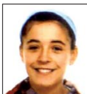
Saioa Zorionak! Hamabi muxu handi eta ondo pasa zure egunean. Familiaren partetik.