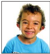
Julen Zorionak familiaren partetik. Zortzi mila muxu handi!