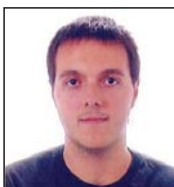
Eneko Zorionak guapo! Zure neskenaren partetik!