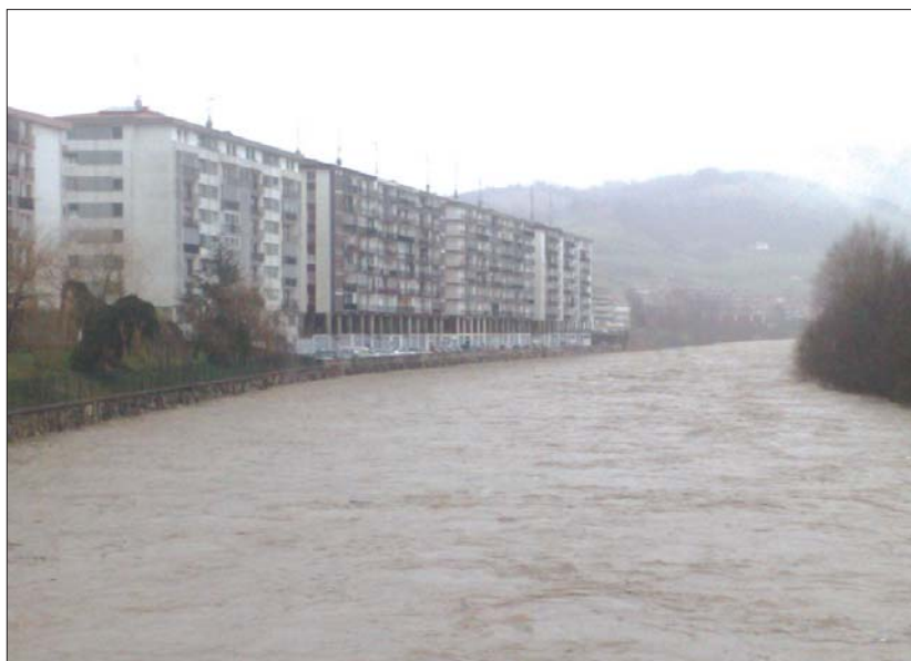
Azpiegitura berri honek Lasarte-Oria, zein Usurbilgo 25.000 biztanle ingururen hondakin-uren isuria saihestuko du Oria ibaian.

Saneamendu azpiegitura berri honek 25.000 biztanle