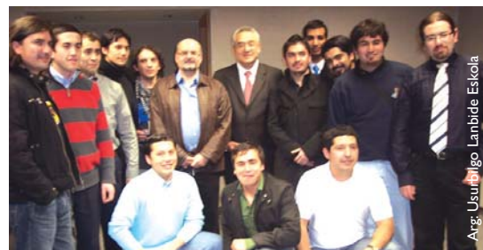
Arg: Usurbilgo Lanbide Eskola

Martxotik aurrera Txileko Zuzendari talde bati ere formakuntza emango dio hainbat saio Valparaisoan zein Usurbilgo Lanbide eskolan garatuz. •