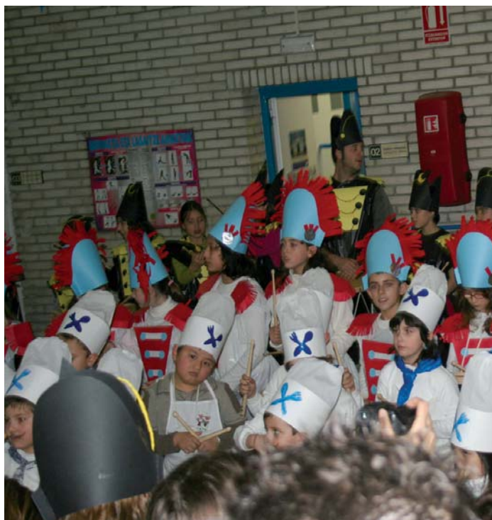
Sasoeta-Zumaburu ikastetxeko haurrak gimnasioan ospatu zuten danborrada.