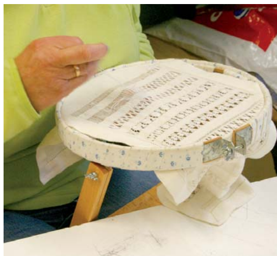
Oso gauza politak egin zituzten aurreko ikastaroen bainikarekin.

Ikastaroetan izena emateko edo hauen berri gehiago jakiteko deitu 943 371 448 telefono zenbakira. •