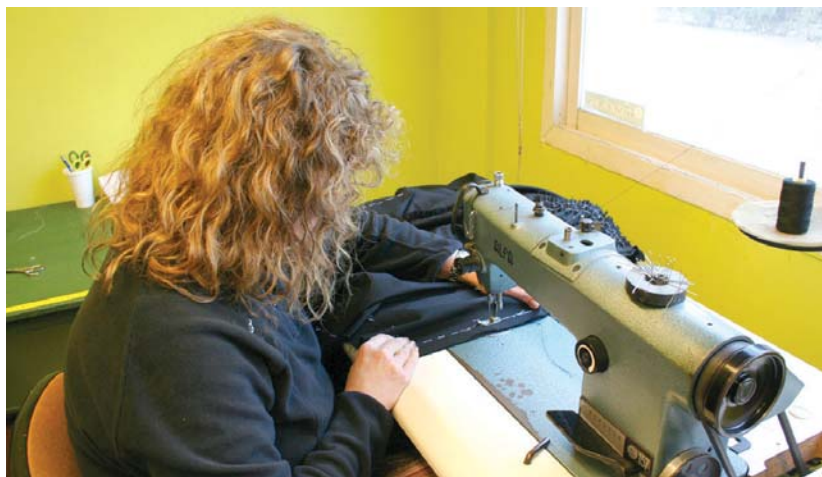
Aurreko ikastaroetan bezala, josteko makinak eskura egongo dira.

Ondorioztatzen denez, esku trebetasuna eta gustu asko duen ikasleri potentziala dago herri honetan eta ikastaroetan erakutsi dutenez beste eskulan zenbait egiteko abileziak ere badituztela ikusiz, dei egiten zaie edozein era eta material erabiliz apaingarri politak egiteko gai direnei jar daitezela harremanetan Ttakunekin Dekorazio, apainketa, jantzi, koustimizazio, zaharberritze eta dena delako eskulanetan trebezia dutenei elkarrengandik ikasi daitekeelako.