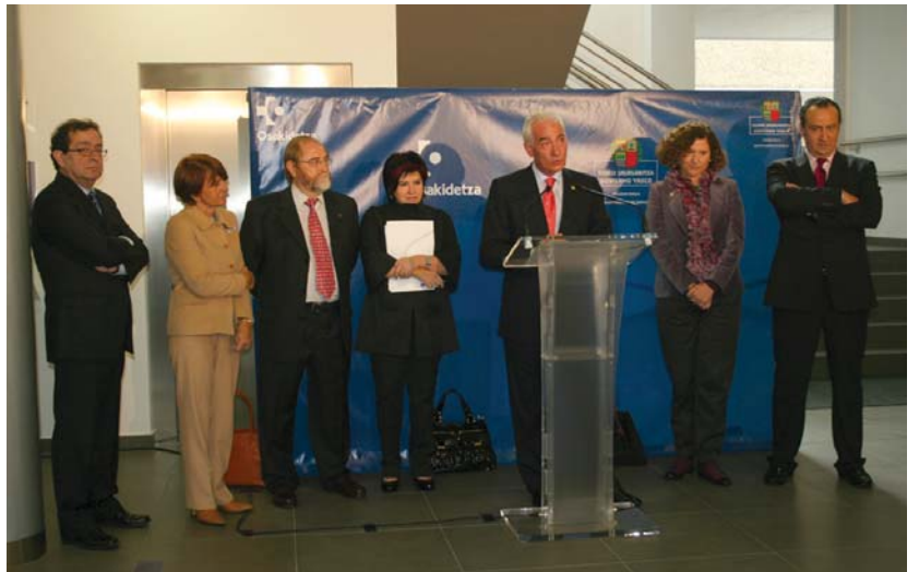
Agurra, zinta mozketa, eraikin berriatik bisita bat, agintarien hitzak eta luntxa. Ez zen ezer falta inaugurazio ekitaldian.