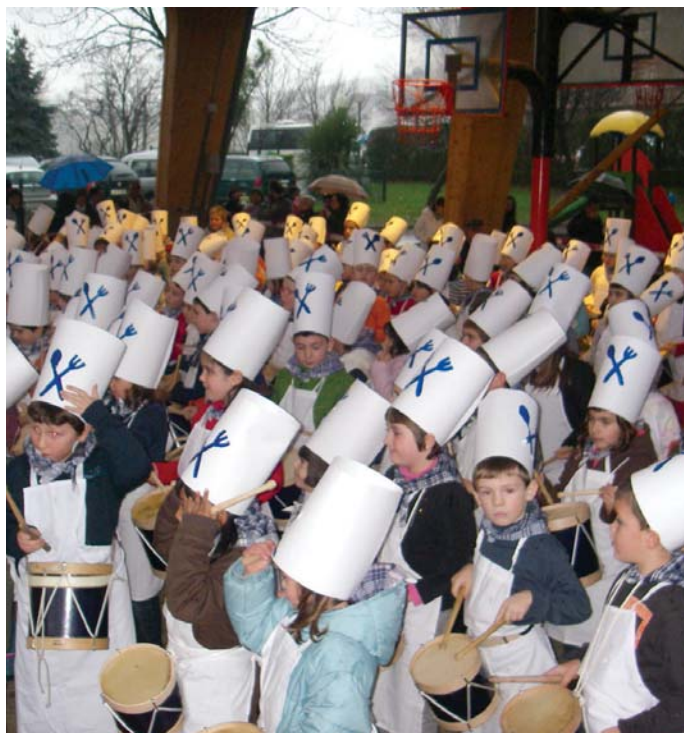
Landaberri ikastolako haurrek jolas lekuan dagoen aterpearen azpian jo zituzten danborrak.