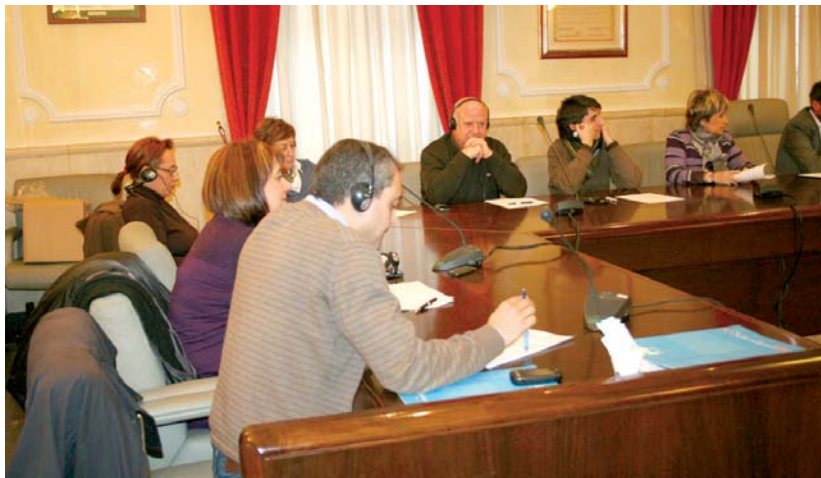
Aste honetako bilkuran estreinekoz erabili zuten aldebereko itzultzailea.

"Era honetara, zinegotziak laguntza edo aholku independentea izango dute hauei dagokien funtzioa era egokian