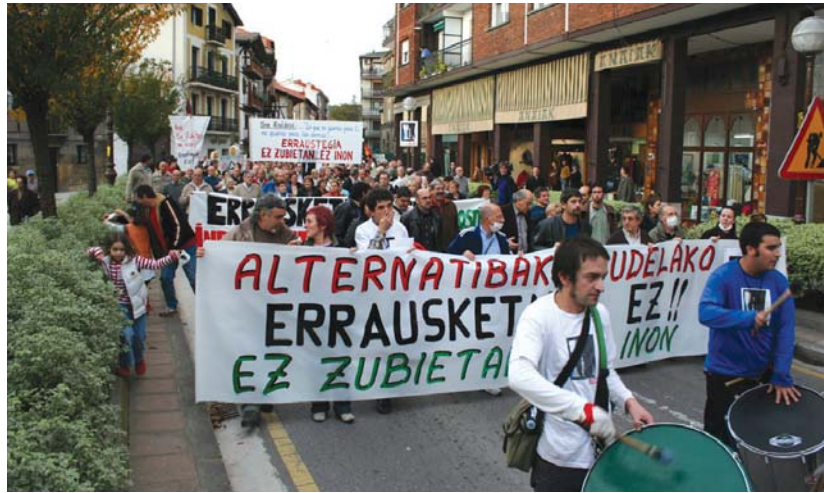
Milaka pertsona bildu ziren errausketaren aurkako manifestazioa egiteko, 2006ko azaroaren 25ean, Lasarte-Orian.

nakundeak Herri Ekimen Legegileak errausketa ukatzen du. "Euskal Autonomia Erkidegoan hondakin horien ustiapena ez da inolaz ere errausketa izango. Hiri-hondakin solidoak eta, batez ere, plastikoak erraustean sortutako igorpenak ikertzen ari direnez, ez dago bermatuta ingurumenean ondorio kaltegarriak sortzen ez denik". Hori dela eta, errausketaren aukera alboratzen dute.