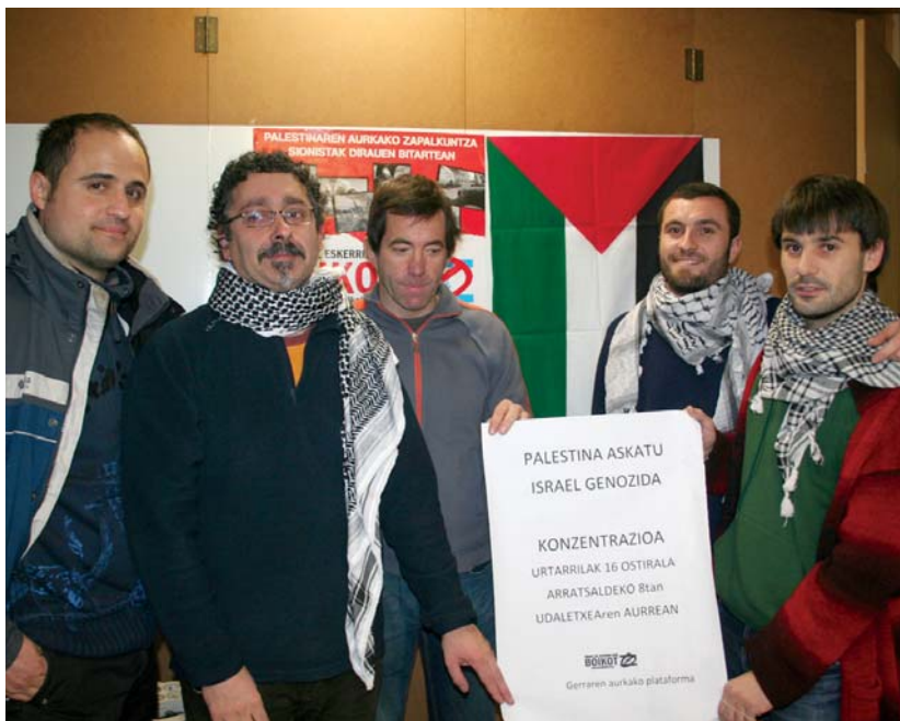
Lasarte-Oriako Gerraren Aurrakako Plataformako kideek asteartean egin zuten konzentrazioarako deia.

Azkeneko hirurogei urte hauetan Palestinako herriak israeldarregandik jasaten ari den erasoei azken sarraski hau gehitzen zaiola salatu du Lasarte-Oriako Gerraren Aurrakako Plataformak. "Bortizkeria etengabekoa da; hilketak, umilazioak, bizitzeko ezinbestekoak diren baliabideen gabetzea, ura, argindarra eta osasun zerbitzuak adibidez. Gazan, egun hauetan gertatzen ari den bezala, gizarte zibilaren kontrako nahitaezko erasoak. Eraso hauek Nazioarteko Eskubideak gizartearen kontrako krimeneztat jotzen ditu", gogorarazten dute, "Hala eta guztiz ere, Europar Batasunak, gure agintariekin barne, Israelekin dituen harremanak indartzu