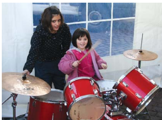
Musik-eskolan bateria jotzen ikasteko aukera izan zuten hurbildutakoek.