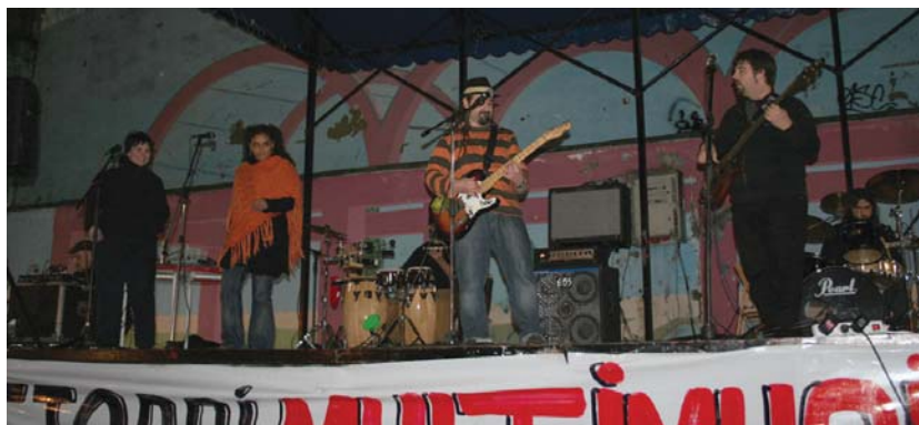
Irudian, igandean herriko Makulu Ken taldeak eskainitako kontzertua.

Udaletxearen jarrera aipatu beharrekoa da: oraingo honetan jausi dira katamaloak, udaletxeari maskara, aurpegi polita kentzea lortu dugu. Mila adibidez erakutsi digute, praktikan oraingoan ere udaletxearen lana herriko gazteok egin behar izan dugula. Hitz emandakoak betetzeaz ere ez dira arduraturik: igandean Buruntzaldeko pilota txapelketa zegoela eta guk gogorazari behar izan genien komenigarria izango litzatekeela udaletxeak komun publiko batzuk egokitzea, hurrengo egunean umeez era duin batean jokatzeko aukera izan zezaten. Hori betetzeko gai ere ez ziren izan, asteburu osoan zehar jendeak txixa zarratza botatzeko ere lekuak bilatzen jardun behar izan zuen. Benetan diogu, oraingoan argi eta garbi ikusi dugu udaletxe gobernu arduragabe osatutako gobernu bat dela, eta benetan Gazte Saila kudeatzeko ahalmen agerikoagoak ditugula egun antolakuntzan ibiliren gazteok hilean milaka eurotako soldata jasotzen duten burokrata kuadrilak baino. Argi eta garbi. Ezpairik gabe, traba besterik ez dute jarri, beraien papera laguntzea izan beharko lukenean.