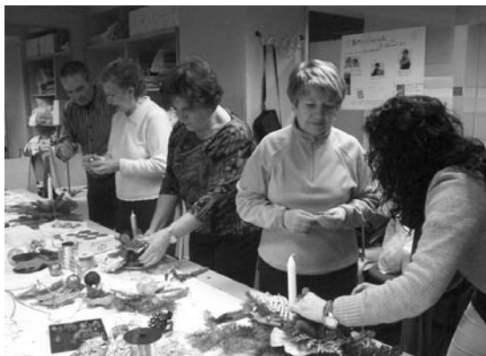
Eguberrietako jardueretan emakumeek mahai zentroa nola egin ikasi zuten.

Dohainezko ikastaro eta jarduerak ere badaude, frantsesa, irakurtzeko txokoa, bideoforuma edo lehen aipatu ditugun inauterietako konpartsa eta mantentzeko gimnasia, esate baterako.