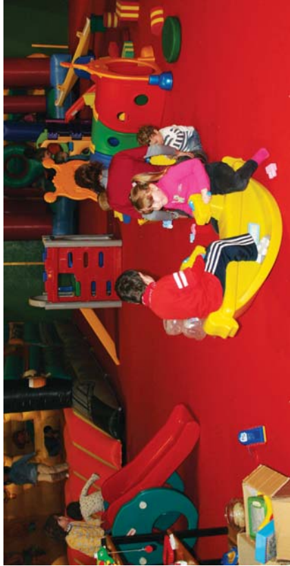
Eguberrietako Haur Parkeak, goko argazkian eta behekoan, Urte Zahar eguneko dantza izan dira, kale herizaileren ekintzekin batera. Udalerriaren biloritzeko hirpide.

"Mozorroak, karaoka, txangoak, sukaldaritza... egunero hamaita abentura bizi izan dituzte Gabonetako txokoetako haurrek"