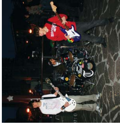
Desazer: 92 rock taldeak estreinadi kontzertua eslatu zuen Andatza plazan.

Kale Heziketa-ekintzetan, herriko gazteekin batera, zuten eta emanaldi ezberdinez gozatzeko aukera izan zen aratsaldean haur eta gazteekin. Musikak eta dantza, giro bikaina izan zen aratsaldean, antolatutako adierazi dituzte, kalea gune beziragarri bezala aldarrikatzea eta herriko gazteei denbora libreko eskantze zabaltzea dira.