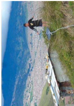
Begian nahikoa lan dute bitarteko. Lau milioi desplazatu daude Kolonbian