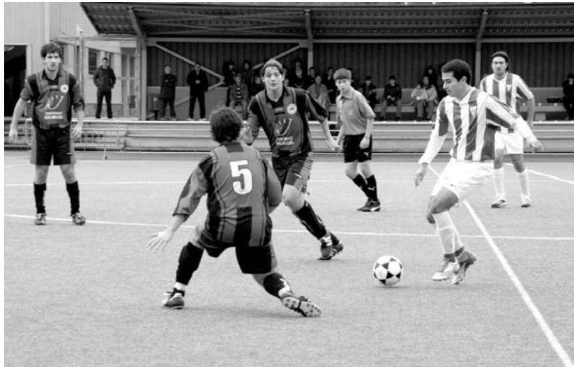
Irudian, lehenengo asteko erregionalen arteko derbia. Ordurako Ostadar igoera faserako sailkatua zegoen.

Hau honela izanik, sailkapena aztertu eta asteburu honetako emaitza kontuan izan gabe, Ostadarreko taldeek hurrengo faserako txartela eskuratua zuten dagoeneko.