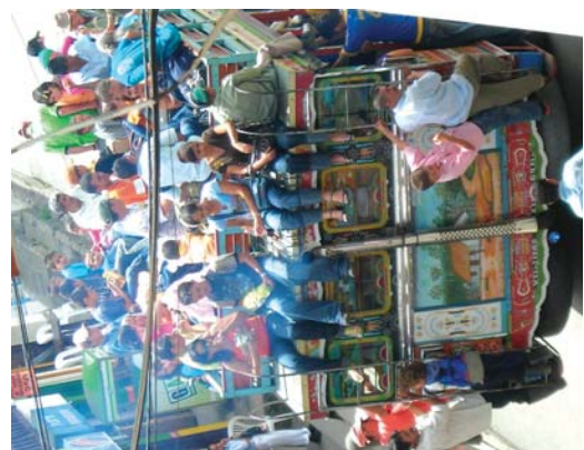
Hiriera joan beharrean izan dira nekazari asko.