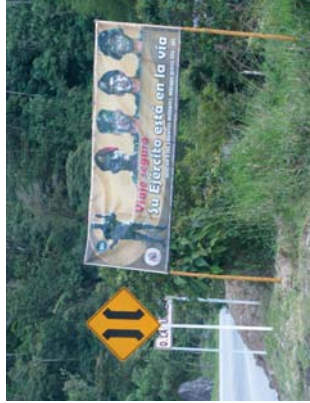
Kolonbiako ejerzitza, Barne Produktu Gordienaren parte handi, prozesen du.