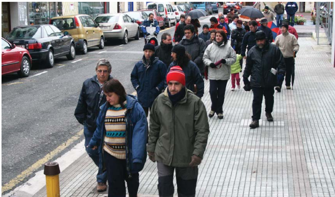
Lasarte-Oriako taldea Okendo plazatik Zubietara abiatu zen euriari eta haizeari aurre eginez.