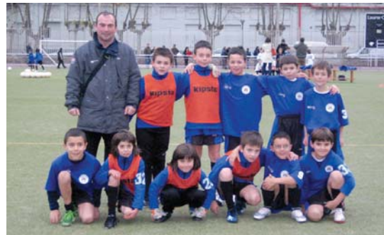
Futbol Eskolako txikiak Michelingo futbol zelaietan.

Futbol Eskoletako taldeek lehiatu ezin duten arren, urtean zehar topaketa desberdinak antolatzen dituzte eskola desberdinen artean haurrak elkar ezagutu dezaten. Josean Belartietak eskolako arduradunak azaldu duenez, "beste eskole-