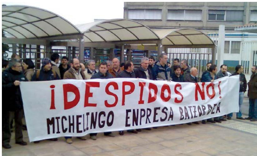
Duela urte bete, gutxi gora behera, enpresa komiteak lanpostuen murrizketaren aurka egin zuen.

argudiatu du. "Mundu osoan langileak bortizki astintzen dituen krisi kapitalista bizi da. Euskadin eta Estatu osoan mila dira langabeziako zerrenda betetzen duten ibilgailuen industria, zein erakuntzako langileak, bai enpresen ixteagatik edo enplegua erregulatzeko dosierengatik. Gainera, oraindik ez da, borroka mailan, indar