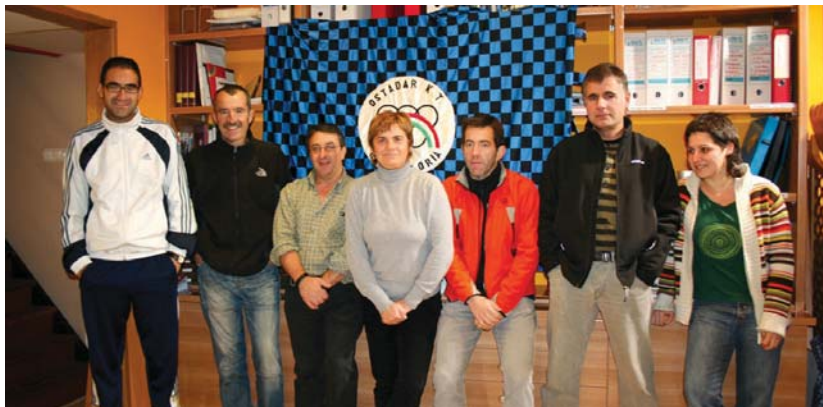
Ostadar Kirol Fundazioko sail desberdinetako kideak asteartean egoitzan egin zuten prentsurrekoan.

Ostadar Kirol Fundazioak asteartean 2009. urteko Bazkide Kanpaina "25 urte eta gero" lelopean aurkeztu zuen elkarrearen egoitza berrian, baita hurrengo urtetik aurrera martxan izango dituen kirol atal berriak ere -mendia eta zikloturistak.