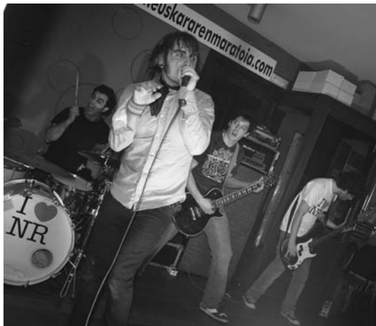
Naizroxak kontzertu laburra baina bizia eskaini zuten Jalgin ostiralean.

Mikel Laboa ere gonbidatu zuten: bere ahotsa erabili zuten hasteko eta tarteko beste abesti batean. Baina, bestela, Naizroxa taldeak zuzeneko gordina eta indartsua du, eritimo aldaketa handikoa. Dena eman zuten ostiralean, atsedenean ia hartu gabe, ikusleen gozamenerako. Baju jole berria aurkeztu zuten taldeak ostiral gauean Jalgin emandako kontzertuan. •