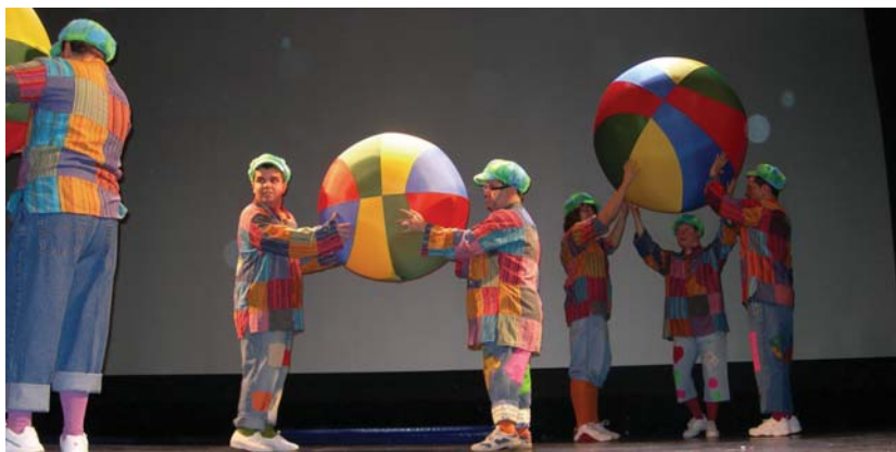
Hunkigarri bezain ikusgarria izan zen Jalgunek larunbat arratsaldean Kultur Etxean eskainitako emanaldia.