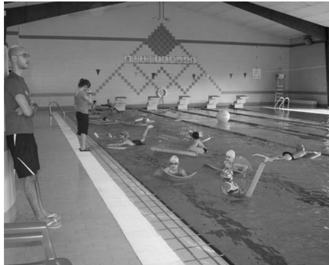
Igerilekuan lau gune jarri ziren joku ezberdinetan aritzeko.

E skola kiroleko topaketak ospatu zituzten larunbat goizean, Lasarte-Oriako udal kiroldegian. Bertan 8 eta 9 urte bitarteko 100 haur inguru elkartu ziren igeriketa eta saskibaloian aritzeko. Benjamin mailako lehen topaketa izan da eta ardurdunen hitzetan, "topaketak harrera ona izan du. Ia 100 haur gerturatu dira kirola egitera eta giroa oso alaia eta polita sortu dute".