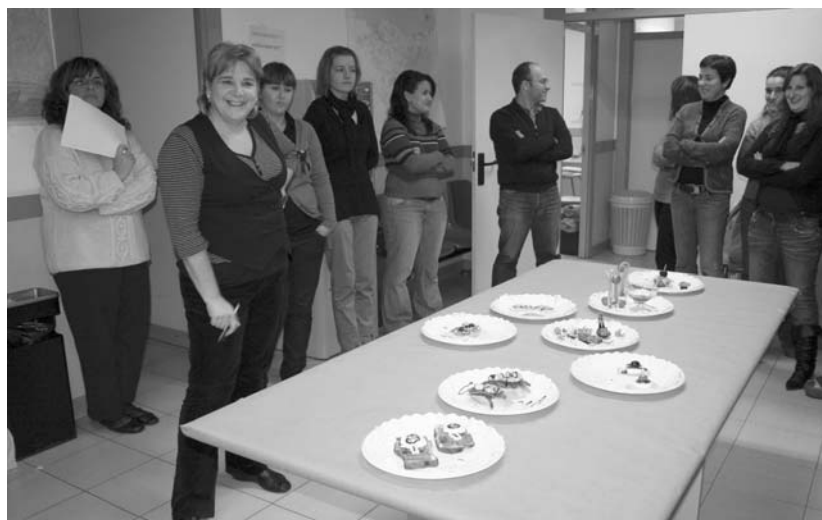
Pintxo lehiaketa egin zuten ostegunean Udal Euskaltegian.

Udal Euskaltegiko ikasleek euren trebetasun gastronomikoa erakusteko aukera izan zuten ostegunean burutu zen pintxo lehiaketan. 16 pintxo hotz prestatu zituzten, 8 goizeko taldeek eta beste 8 arratsaldekoek, epai mahaikoan esanetan pintxo bikainak guztiak. Esan daiteke, aurten itsasoa eta itsasoko produktuak atera direla garaile. "Itsasoa eta lurra" eta "itsaso gorria" izeneko pintxoak jaso zituzten sariak. Lehenengoak beste beste izokina eta otarrainxa zeuzkan eta besteak aipatutako bi osagaiak eta antxoak ere bai.