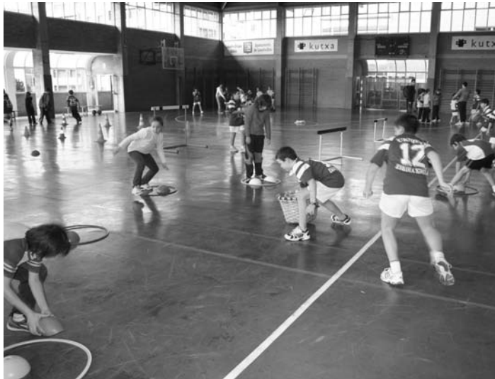
Polikiroldegian saskibaloari lotutako jolasetan aritu ziren.