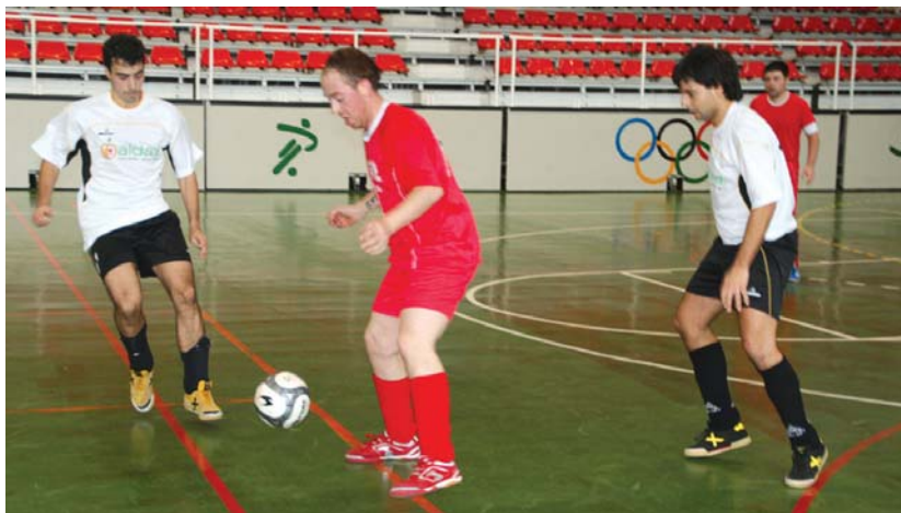
Aldatz Hortz Klinikak taldea Euskal Ligan lehenak estreneko denboraldian.