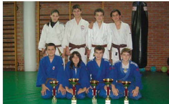
LOKEko judoak Amurrioko txapelketan irabazitako sariekin.