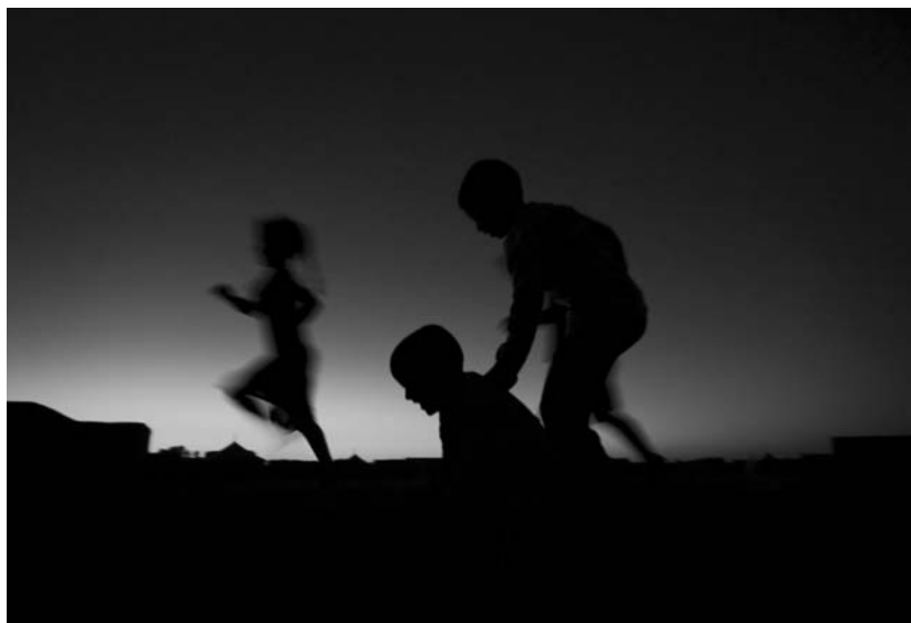
Zuri beltzean edo koloretan, argazkiek, saharaiarren kanpamentuetako eguneroko bizitza erakusten dute.

"ze pena" esaterik nahi. Bizitza oso arrunta eta oso duina daukate. Borrokalariak dira, mundu guztiak bezalaxe bere gauzak dituzte. Ez dut Saharako egoera politikoa ekarri nahi izan, hori ezaguna da. Egunerokoa isladatu eta bizitza horren hausnarketa ekarri nahi izan dut.