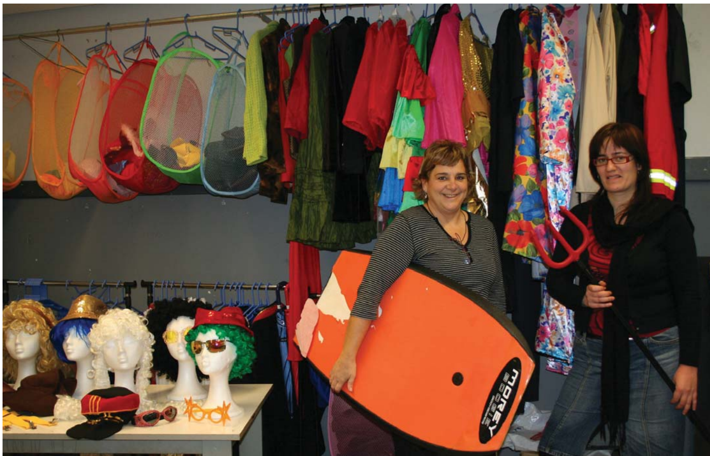
Ostegunero goizeko 9.30etatik 11.30etara jasoko dira arropa eta bestelako osagarriak, Erribera kalean Ttakunek duen lokalean. Jantziak emateko prest daudenek bertara eraman beharko dituzte.