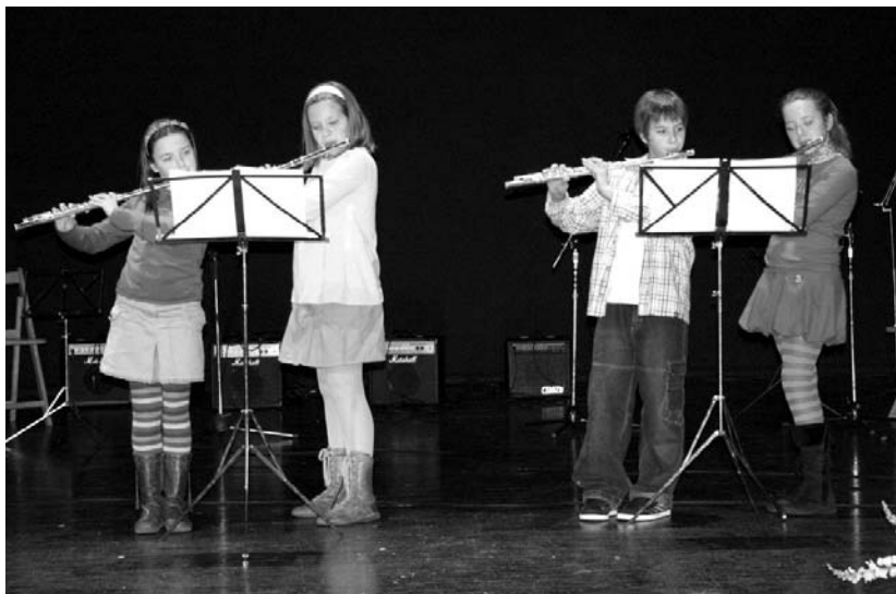
Argazkian, zeharkako flautako ikasleen laukotea iazko Santa Zeziliaren omenezko emanaldian.

Musikalean herri edo hiri bakoitzeko kaleetan ekintza