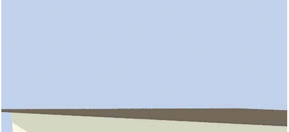
Kompong Seutik gertu egingo da Zuraren eskola eta hau da arotz tailerrek izango duen itxura.

Taldearen ideia Asia hego eta ekialdeko herrialde bati laguntza ematea zen eta azkenean Kanbodian arotz tailerra eraikitzea erabaki zuten. "Arotz tailer hau ikasleek praktikak egiteko erabiliko da eta beharrezkoak dituzten makinekin gainera", azaldu digu Arantzak.