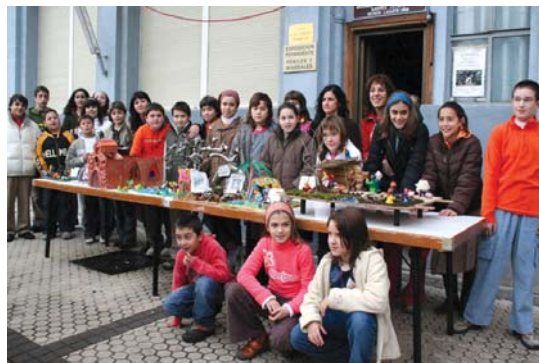
Irudian iazko lehiaketako parte hartzaileak eta irabazleak.

Jaiotzen lehiaketan banaka nahiz taldeka parte har daitezke. Lanarekin batera gutunazal itxi bat entregatu behar da. Honen azalean, parte-hartzaile edo taldearen adina idatzi behar da. Neurriari dagokionez, jaiotzek neurritz gehienez 80x60 cm. izan daitezke eta ez dute onartuko hondo sendokoa ez duen