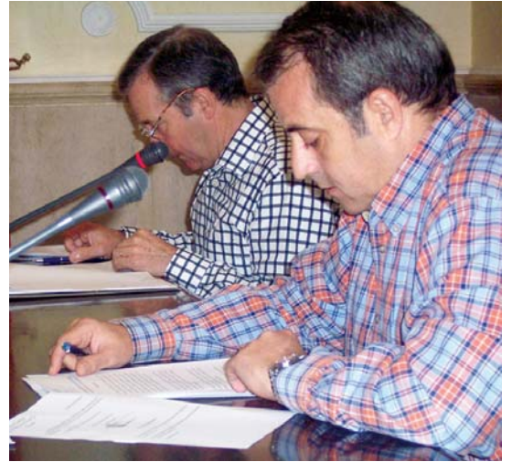
Ezker Batua-Berdeako zinegotzia aurkeztutako mozioak irakurtzen.

Ortegak "Sofia erreginak herritarren eskubide zibilen gainean egin dituen adierazpenak deslegitimatzea" eskatu zuen. Mozioa bertan behera geratu zen, EAJko boto bakarra alde izan baitzuen eta gainontzekoak PSE (7) eta PP(1) kontra. •