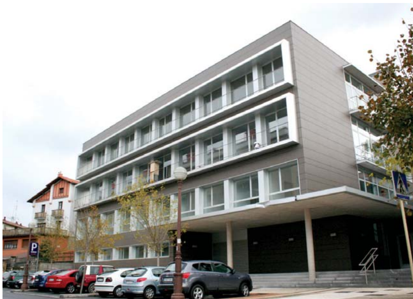
Udal ordezkariak Loidi-Barrengo anbulategi berriak urte amaierarako zerbitzuak eskainiko dituela espero dute.