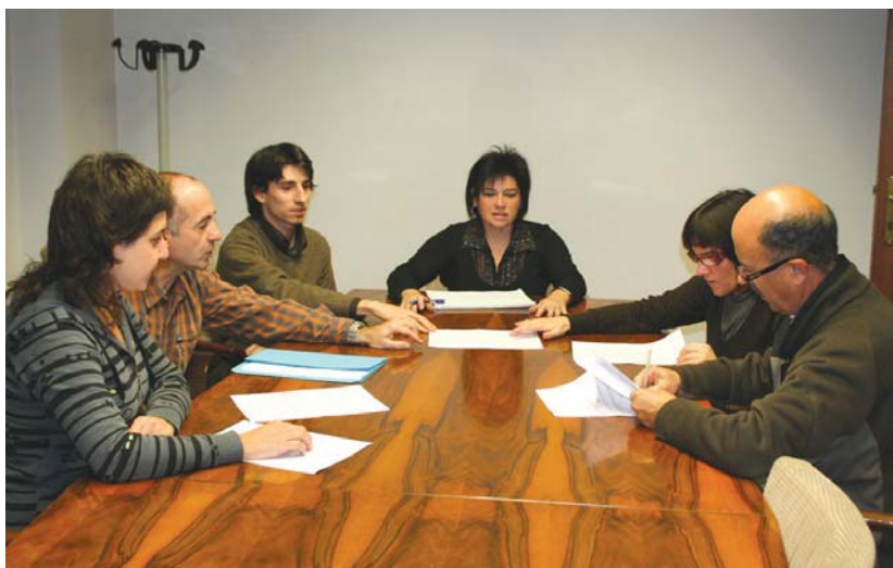
Asteartean sinatu ziren lankidetzako hitzarmenak Lasarte-Oriako udala eta herriko kirol elkarten artean.

Kirol federatuen emakumearen partehartzea bultzatzeko asmoarekin, azaroaren 4an, lankidetzako hitzarmenak sinatu ziren Lasarte-Oriako Udala eta herriko kirol elkarten artean.