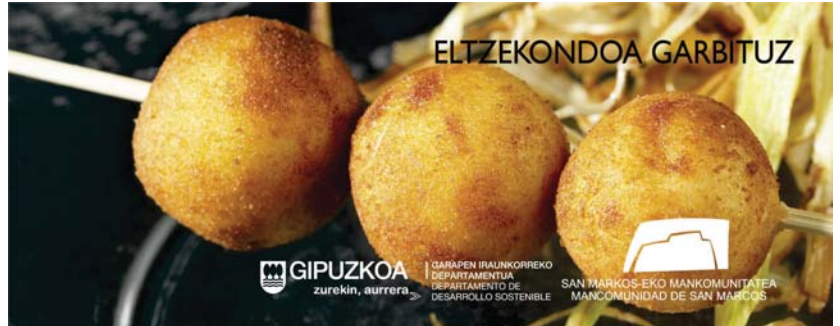
"Eltzekondoa Garbituz" janariari probetxu ateratzeko kanpainaren izena da.

Liburuko informazioa lau ataletan banatuta dago: lehen ataletan daude liburuaren oina-