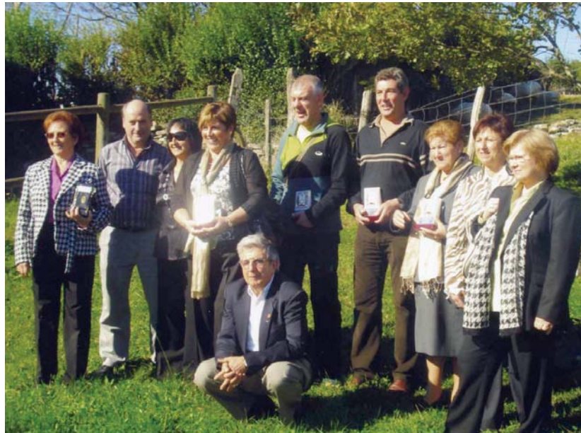
Herriko odol emaileak gainontzeko herrikoekin bildu ziren Tolosan egindako bazkarian

Odol emaileak saritu dituzten arren oraindik emaile gehiago behar dira. Nahiz