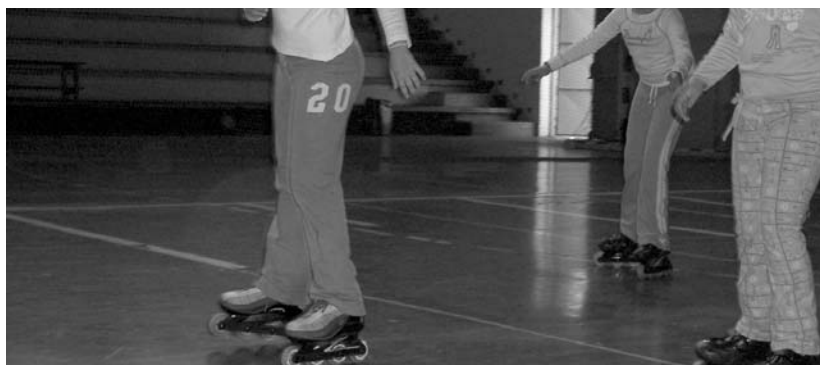
Ikastaroetako bat patinajea izango da, beraz gazteek aukera ederra izango dute patinatzen ikasteko.

Eta honetaz gain, aurreko hiruhilabeteetako ikastaro kopurua handitu du Gazteria sailak.