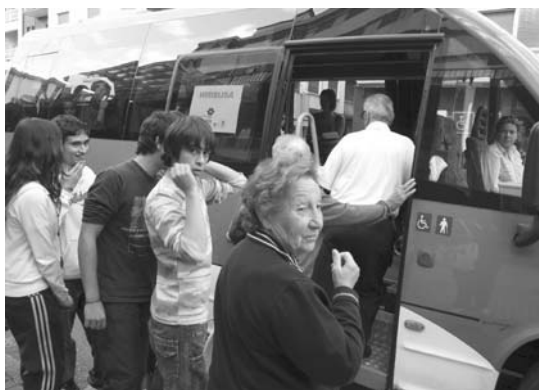
Ostegunean erabiltzaileen ezaugarriak eta dituzten premiak jaso zituzten.

tan hiri-busa hartu zutenak, esaterako: zorutzen zeuden hiri-busa jarriko duten esperantzaz. Auzotar batek esan zigun denda txiki bat bakarrik dela auzoan eta enkarguak egitera jaisten direnean autoa eta karrotxoa hartu beharra dutela, hipodromoan edota Sasoetan aparkatu eta erosketak egin. Beste baten ustez jendeak erabiliko luke, jende heldu asko baita auzoan, autorik ere ez duena. Hirugarren batek zioen, autoan jaitsita ere ez dagoela erdian aparkatzerik, eta adindu asko daudela jaisterik ere ez daukatenak.