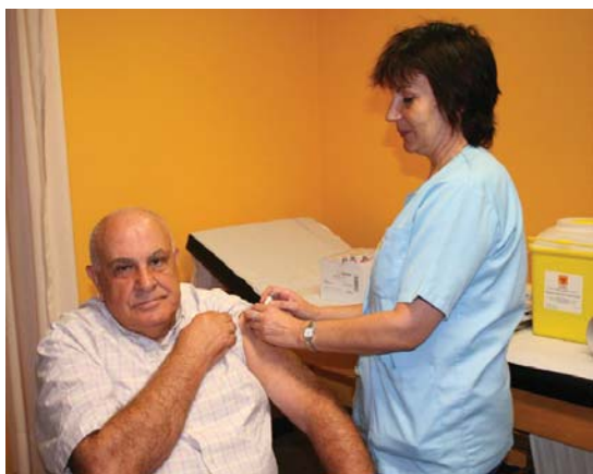
Medikuek txertoa jartzea gomendatzen dute konplikazioak saihesteko.