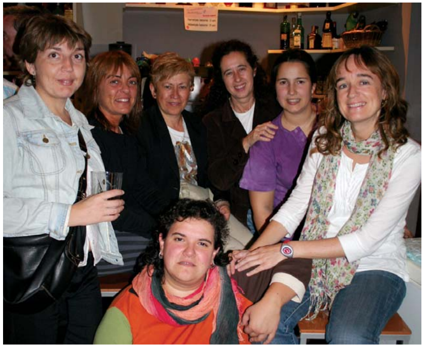
Solaskide egitasmoa tresna bat da "euskaldun oso" izan nahi duen horri laguntzeko, bultzadaxoa emateko.

tzoan euskara irakasten baina gutxitan pertsonak euskaldun izan daitezten.