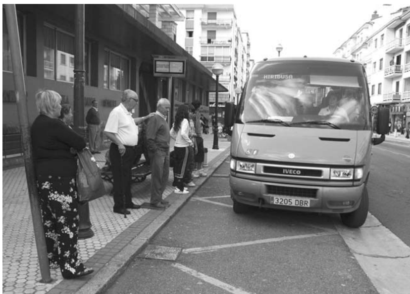
Erditik urruti bizi direnek, Zabaleta eta Antxisukoek erabili dute gehien hiri-busa.

Itzuli osoan joan zen autobusa beteta. Batzuek zioten pisuarekin doazenean edota eurria ari duenean erabiliko luketela. Beste batzuek, beti. Zabaletara igo zirenak eta ber-