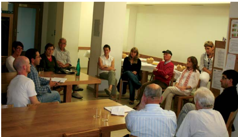
Solaskideko euskaldun zaharrak, bilera egin zuten Arrieskalleta elkartearen datorren kurtsoari dagokien berrikuntzen eta nobedadeen berri izateko