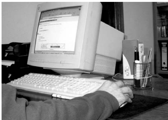
Sistema informatiko eta kudeaketa teknika berriak irakatsiko dira.

Plan honen helburua merkatal sektorea berritu eta hau profesionalizatzeko marko bat sortzea da. Horretarako birziklatze profesionala eta sistema informatiko eta kudeaketa teknika berriak barneratzen saiatuko dira. Garrantzia berezia emango zaio berrikuntza eta kalitateari. Ikastaro eta mintegiak merkatariek teknologia berrien arloan dituz-