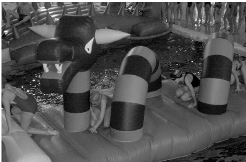
Pistan eta igerilekuan kirola egiteko aukera izango dute haurrek Kirol Ludotekan.

Eskainiko dituzten kirol jarduerak partaideen adinari egokituak izango direla jakinarazi dute kirol zerbitzuetatik. "Saioak, partaide bakoitzaren nahiaren arabera, Udalaren Kiroldegiko bai Igeriketan bai Pista Balioaniztean garatuko dira. Jarduera askotarikoa izango da eta horretarako material ezberdina erabiliko dira: koltxonek, era ezberdinetako