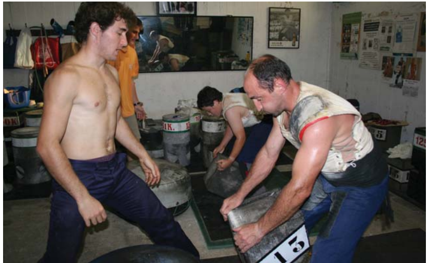
Telleria sendian aita eta hiru semeek dakite zer den harria jasotzea. Neurri, pisu eta forma askotakoak dituzte sotoan.

20.000 euro jokoan, baina apustua hori baino gehiago da, ezta? Aspaldi ez da horrelako apusturik egin, eta gutxiago 22 urteko