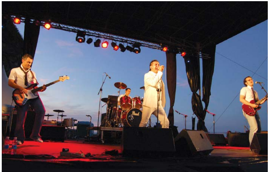
Aurtengo Donostiako Pop Rock lehiaketako finalean hirugarren postua eskuratu zuen Plastic talde lasarteoritarak.

Eta ongi saltzen da, nahiz eta kontzertuetan eta ahoz aho saltzen den. 1000 egin genituen eta gutxi batzuk