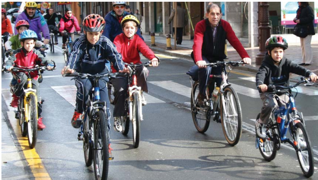
Bi ibilbide antolatu dituzte, luzea eta motza, adinaren arabera nekerik gabe egiteko.