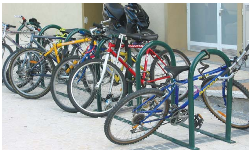
Erabilitako bizikletak trukatu eta saltzeko aukera izango da gaur arratsaldeko merkatuan Okendon.