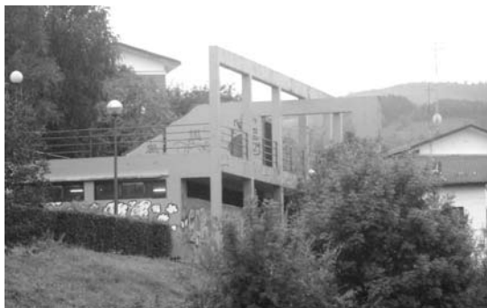
Herriko musikariek entsaiatzeko toki bat izango dute

Gunea erabiltzeko izena emateko edo informazioa gehiago jasotzeko Manuel Lekuona kultur etxean dagoen