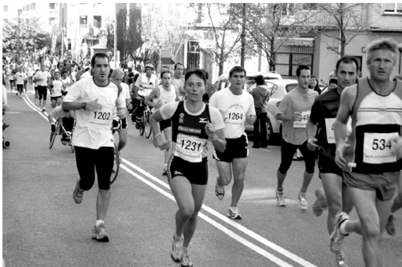
lako edizioan 1.130 korrikalariak hartu zuten parte.