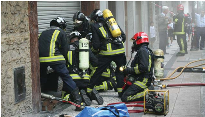
Persiana zulatu eta oxigenoa erabili zuten suhiltzaileek barrura sartzeko.

Su hiltzaileen hiru kamioi, polizia eta ikusminak erakarririk jendetza elkartu ziren atzo arratsaldeko 6ak inguruan Mutiozabal kaleko 7an dagoen Izurde taberna kanpokaldean. Itxuraz sute handia bazirudien ere, zorionez ke laino handi eta beroa zen, baina surik ez. Suhiltzaileek persiana bota, oxigenoa erabiliz sartu eta sutan utzitako sarragin batek eragin zuela ikusi zuten. Gero tabernatik kea ateratzen izan zuten lana baina ordubete ondoren normaltasuna nagusitu zen kalean.