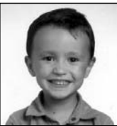
Unax Zorionak, muxu asko familiarren partetik.