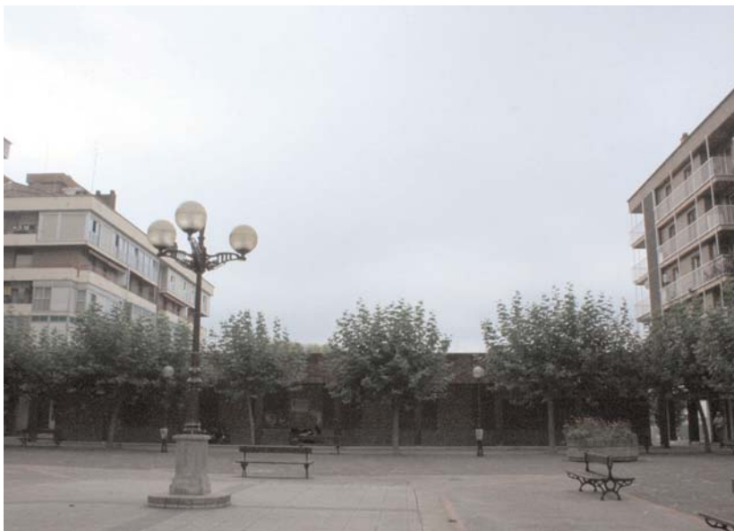
Erabaki gabe dagoen arren, Gaztelekua jartzeko Jaizkibel enparantza aukeretako bat da.

Azterketak bi zati izango ditu. Alde batetik, lasarteoriatarrek ondorengo gai hauen inguruan dituzten beharrak eta eskaerak ezagutzeko balioko du: aisia, ikastaroak, entseguak egiteko gelak, informazioa, etab. "Hori guz-