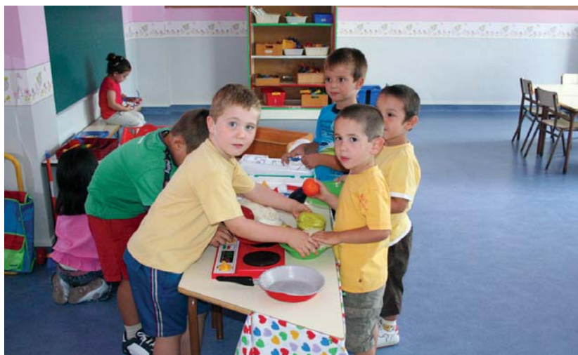
Zumaburuko eskolako hauek gela berriak estreinatu dituzte aurten.