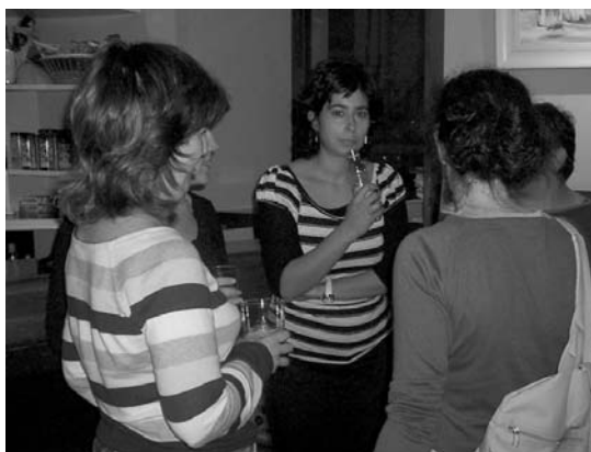
lazio ikasturteko Solaskideko talde bat.

Udal euskaltegietan ordea, izena emateko epea irailaren 19an itxiko da eta kurtsoari hil bereko 22an emango diote hasiera. Bulegoa goizeko 8:30etik 19:15 arte egongo da