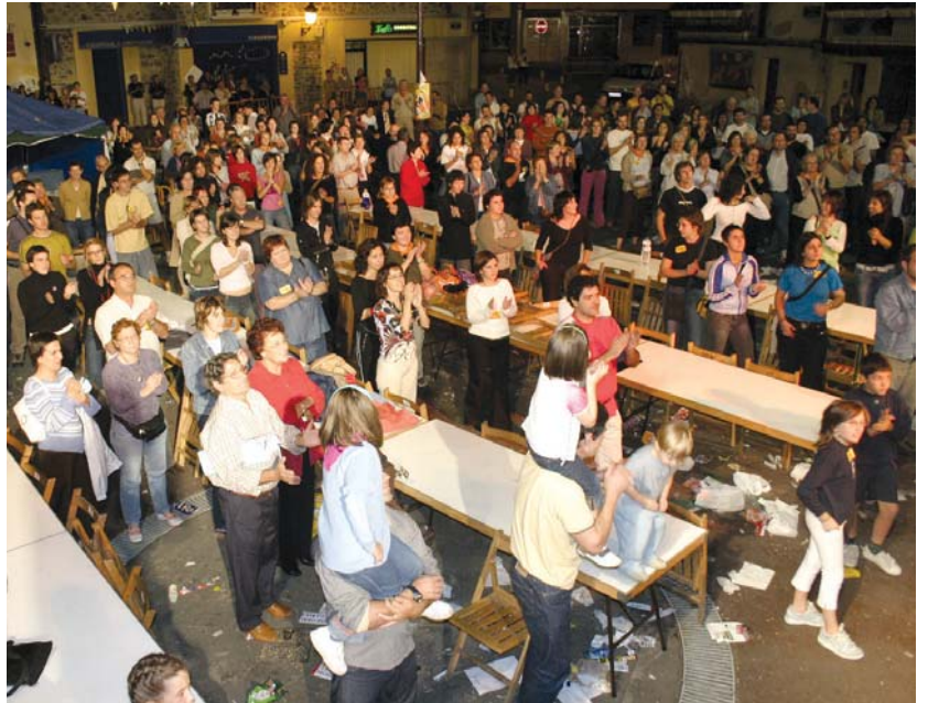
Irudian azken Maratoiko igande gaueko afalosteko dantza saioa; Bero-bero abestiarena, noski!

Bestela ere, laguntzaile moduan aritu nahi dutenek, Ttakunetik (Geltoki kalea 4) pasa daitezke edo telefonoz deitu, 943 371448. Denon artean egingo dugu Euskararen 7. Maratoia! •