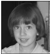
Itziar Zorionak eta 3 muxu handi, famili guztiaren partetik.