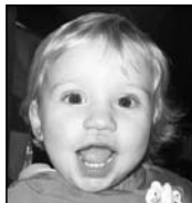
Uxue Zorionak rubia!! 3 muxu potolo zure lehengusuen partetik.