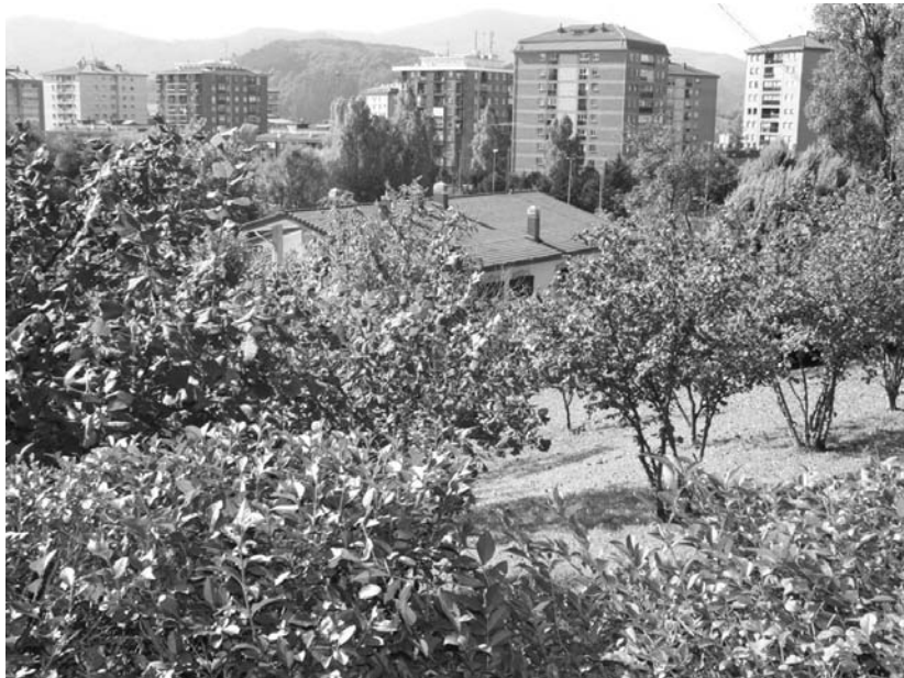
Sinatutako hitzarmenak deposito zaharraren ondoko partzelan frontoi bat eraikiko dela jasotzen du.