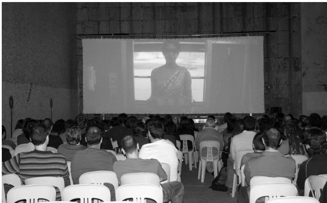
Arratsalde osoan nahiko eguraldi kaxkarra izan bazan ere, azkenean eutsi zion ateri eta jende asko bildu zen filma ikustera.

Hemendik aurrera osteguneko filmekin konformatu beharko dugu. •