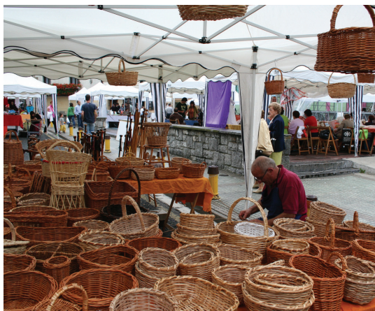
Denetariko lanak erakutsi ziren atzo egun guztian zehar Okendo inguruan.