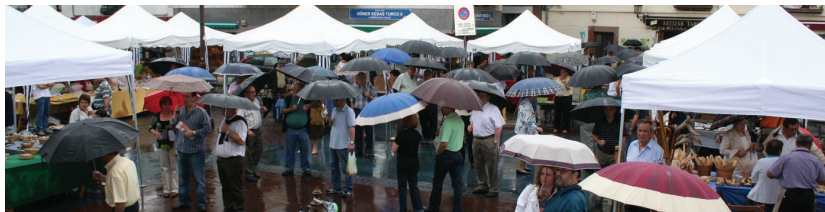
Arratsaldeko azken orduan jende gehiago hurbildu zen artisauen lanak ezagutzeko.

Berasategiri egin diotenaren balioa ere ez da kalkulatzetik. Ideia artisauena euren izan da eta urtero sukaldari bati sukaldian erabiltzeko moduko laban zorrotz eta ikusgarria oparitzeko asmoa dute. Detaile guztiak zaindu dituzte: altzairu onena erabili dute, alde batean Berasategiren ikurra dauka, bestean artisauena, bitxigintzako pieza dirudi. Xorroan ere Berasategiren logotipoa marraztu diote narruan.