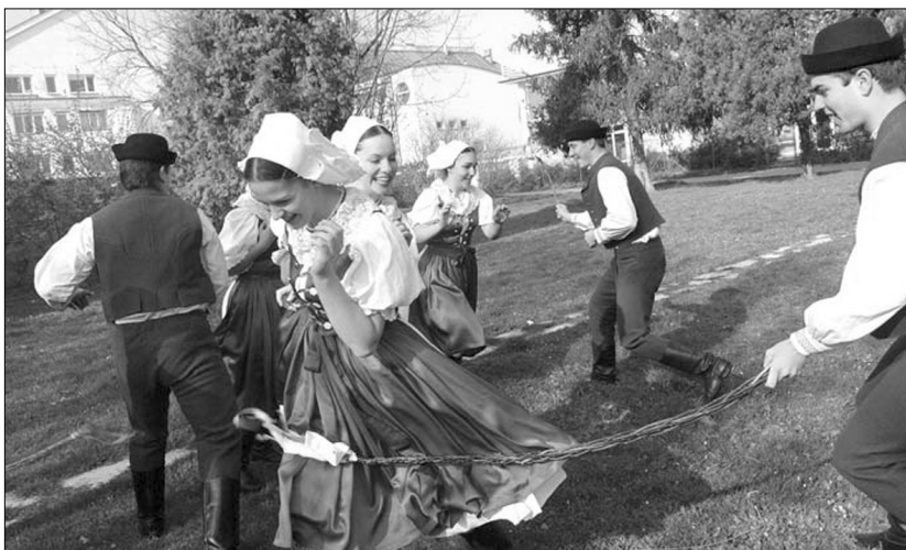
Goiko irudian Mexikoko Kutzi taldea eta behean Eslovakiako Maj Folk elkartea.