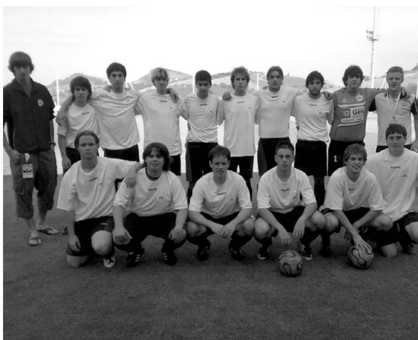
Goiko argazkian Ostadarreko kadeteak eta behekoan jubenilak.

Txintxarri diruz laguntzen duten erakundeak