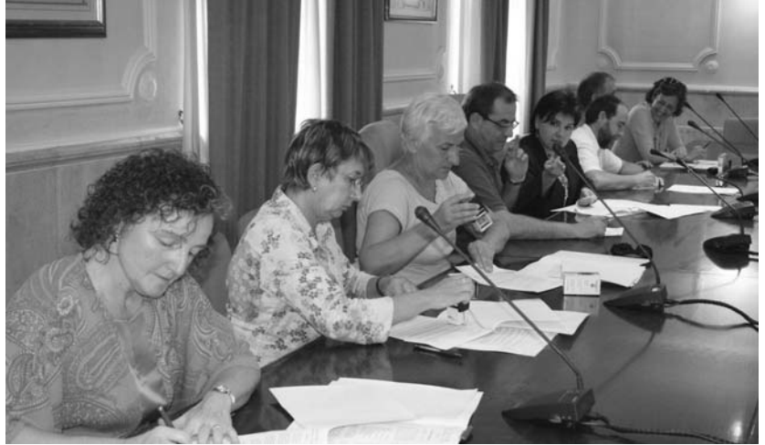
Hitzarmenaren helburua herritarren artean euskararen erabilera sustatzea da.