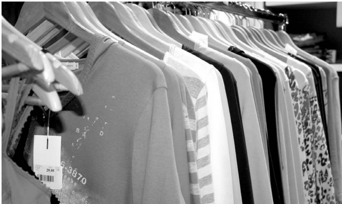
Komertzioek metatuta duten produktuei irtenbide bat eman nahi diote prezio erakargarriekin azoka honetan.