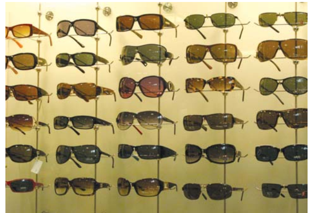
Betaurreko modelo ugari daude merkatuan gaur egun, forma eta kolore askotakoa.

Betaurrekoen funtzioa begia babestea da, hobeto ikusteko eta osasuntsua izan dadin bezitza osoan zehar. Profesionalengana