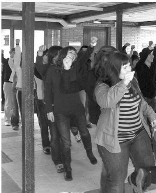
Begiraleek dantzako koreografiak ikasi zituzten asteburuan.

Larunbatean, afaldu eta gero, sorpresa zeukaten prestatua eta Oriotik ibili ziren pista-jolasean. Koordinatzaileek begiraleen rola hatu eta herrian zehar ezkutatu ziren, begiraleek aurkitu behar zituzten haurrak izango balira bezala. •