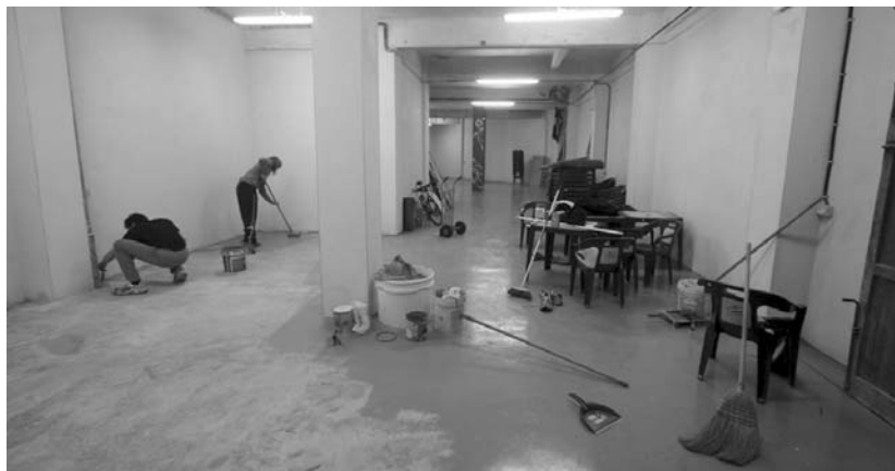
Irudian Gazte Bilgunea hartuko duen lokaleko lanak.

Lokala Ttakun elkartekoa da eta gaztetxe edo gaztelekua ez den beste zerbaitekin sortu nahi da. Dagoeneko txukunduta dago, komuna eta