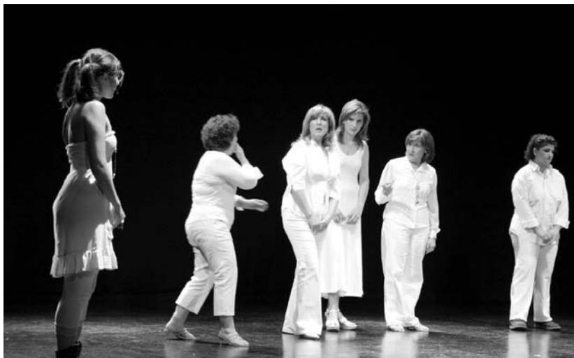
Goiko argazkiak, El secreto bien guardado antzezlaneko une bat; behean, A mi sin alcohol antzezlaneko.