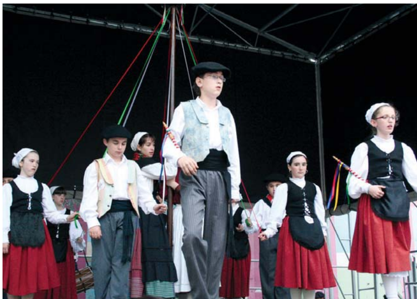
Goizean auzoz-auzo ibili ziren dantzariak; arratsaldean aldiz, Okendo plazan eskaini zuten emanaldi ederrea.