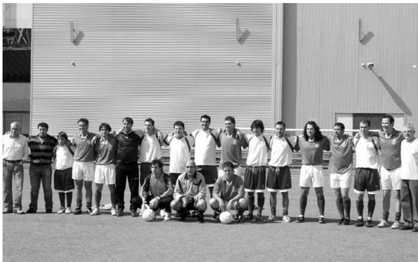
Irudian, partida jokatu zuten bi taldeak batera.

Jendea animatu zen partidak ikustera joateko eta gainera eguzkia atera zenez giro polita sortu zen atzo Michelingo zelaian. •