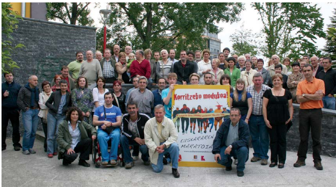
Herriko elkarteetako ordezkari ugari hurbildu ziren Euskararen VII. Maratoia aurkezteko eginiko prentsaurrekora.

□ Astearte arratsaldean egin zuten Euskararen Maratoiko aurtengo edizioko aurkezpena Villa Mirentxun. Zazpigarren maratoia izango da.