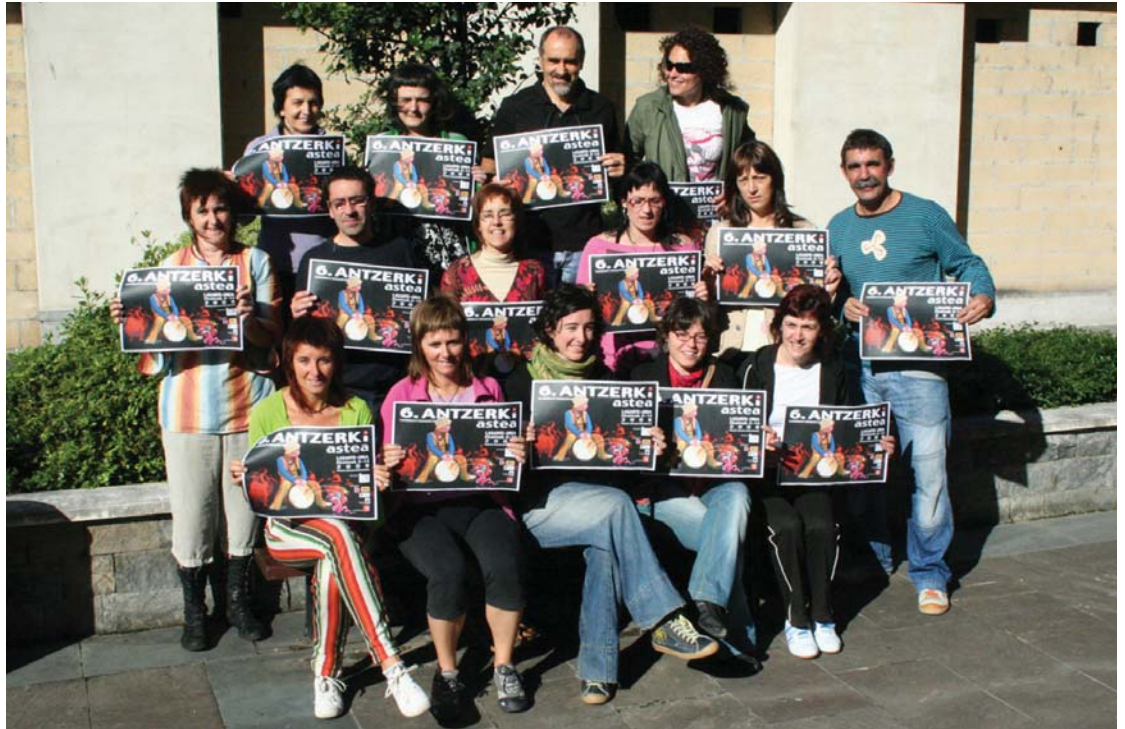
Landaberri Antzerki Eskola eta oro har antzerkia sendo da Lasarte-Orian. Aurkezpenean, Eskolako ordezkari, ikasle eta irakasleak parte hartu zuten.

Antzerki asteari Dantza Garaikidea eta batukadarekin emango zaio amaiera, ekainaren 14an, 20.00ean hasita burutuko den ekitaldiarekin.