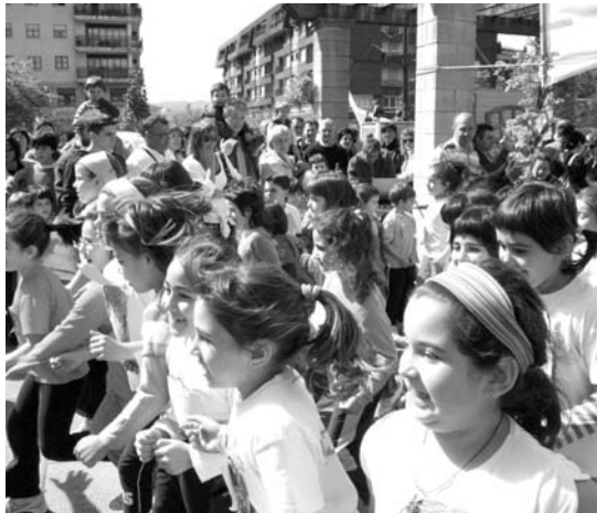
Lasarte-Oria, Usurbil eta Urrietako atletak elkartuko dira larunbatean.

Maiatzean amaituko dira Eskola Kirol saioetako entrenamendu eta jardunaldiak eta aurreko urteetan bezala, jai giroan emango zaio amaiera. Eskola Kirolaren festa honean, kirol ezberdinak ezagutu eta kirola eginez ondo pasatzeko aukera izango dute nahi duten haur guztiek. Horiak dira hain zuzen ere antolatuak aipatu dituzten helburuak ikastetxe ezberdinetan diharduten haurrak elkar ezagutu eta euren arteko harremanak sendotzearekin batera. Denetarikoa aukera izango da gainera: Atletismoa, futbola, saskibaloia, kirol jolasa eta tenisean jardutekoa. Antolatuak diren haur guztiek.