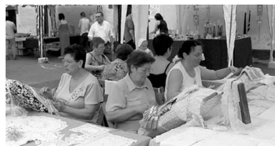
Santa Anako Artisau azokak XXV urte beteko ditu aurten.

Gaur elkartuko dira Sendoki Elkartetik pasa diren kideak, eta, seguruenik nostalgiaz beteak, mahai baten inguruan azkeneko hogeita bost urte hauen errepaso egingo dute. •