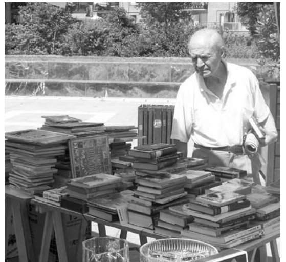
Norbaitek azokan parte hartu nahi badu, Mankomunitatean galdetu.

Informazio gehiago behar izanez gero www.merka2sanmarcos.org gunean edo 943 670249 telefonoan eskatu daiteke. •