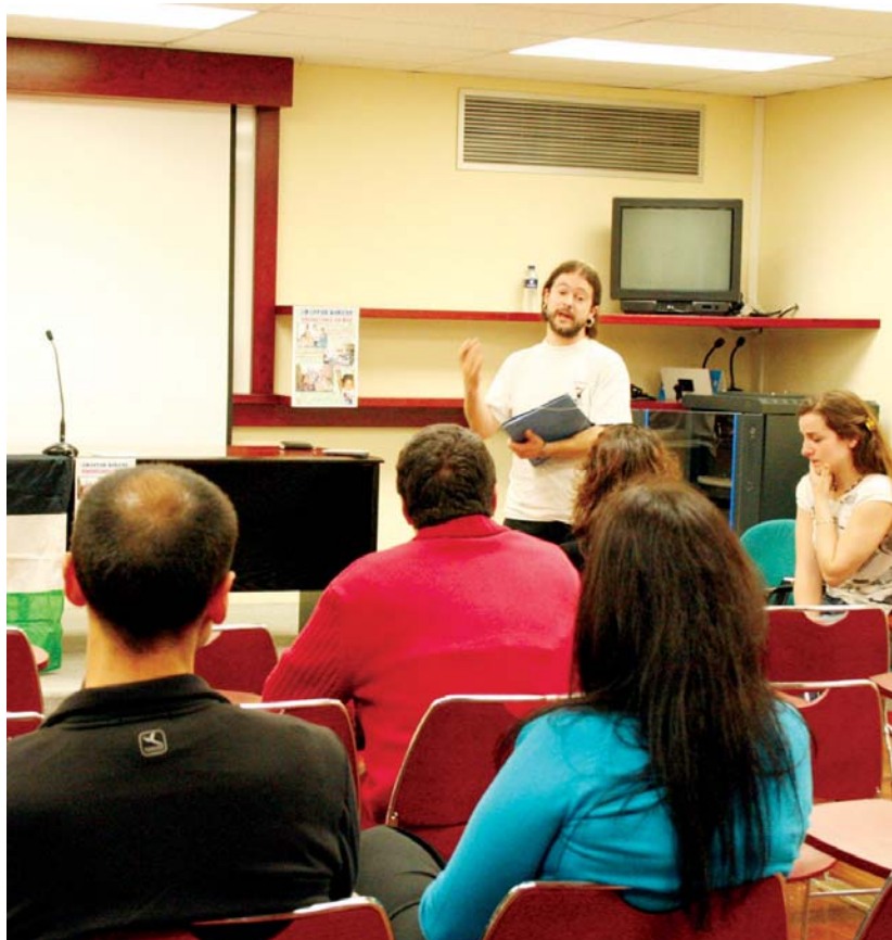
Astearte iluntzean kulturetxean emandako hitzaldian Oporrak Bakean programaren berri eman zuten.

Egonaldiak irauten duen bitartean, kanpamenduetako haur hauek osasun errekonozimenduak egiteko aprobetxatuko dute; bista eta horts-aginak begiratu eta txertoak hartuko dituzte. Baina aisiarako eta ongi pasatzeko aukera ere izango dute. •