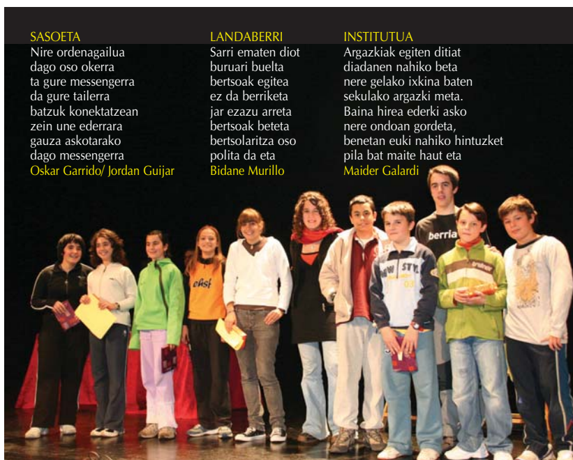
Irabazleek euren bertso sortatik bat irakurri zuten astelehen goizean kultur etxean burutu zen ekitaldian.

165 lan ziren, gehienak lehen hezkuntzako ikasleek