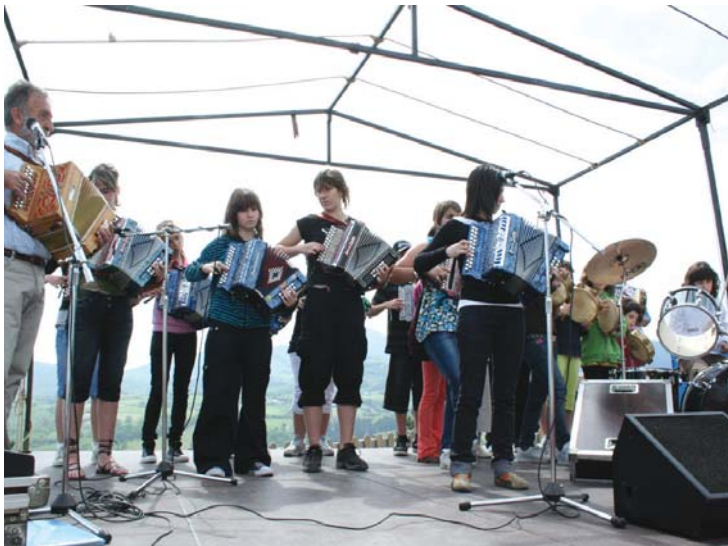
Trikitalari talde ederra Amalur eskolakoena. Ederki girotu zuten erromeria.