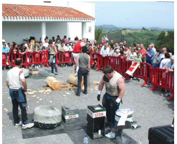
Jende ugari bildu zen ermitaren inguruan. Festaz ederki gozatu zuten.