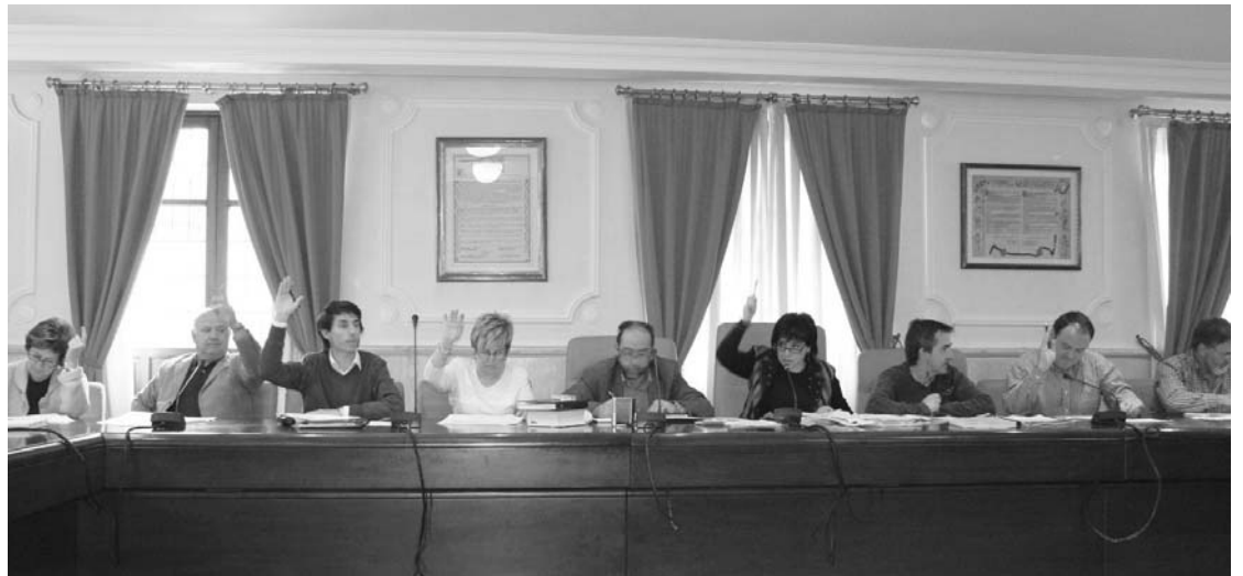
2008. urteko 41.295.000 eurotako aurrekontua, Udalak kudeatu duen aurrekontu handiena, asteazkenean osoko bilkuran onartu zen.