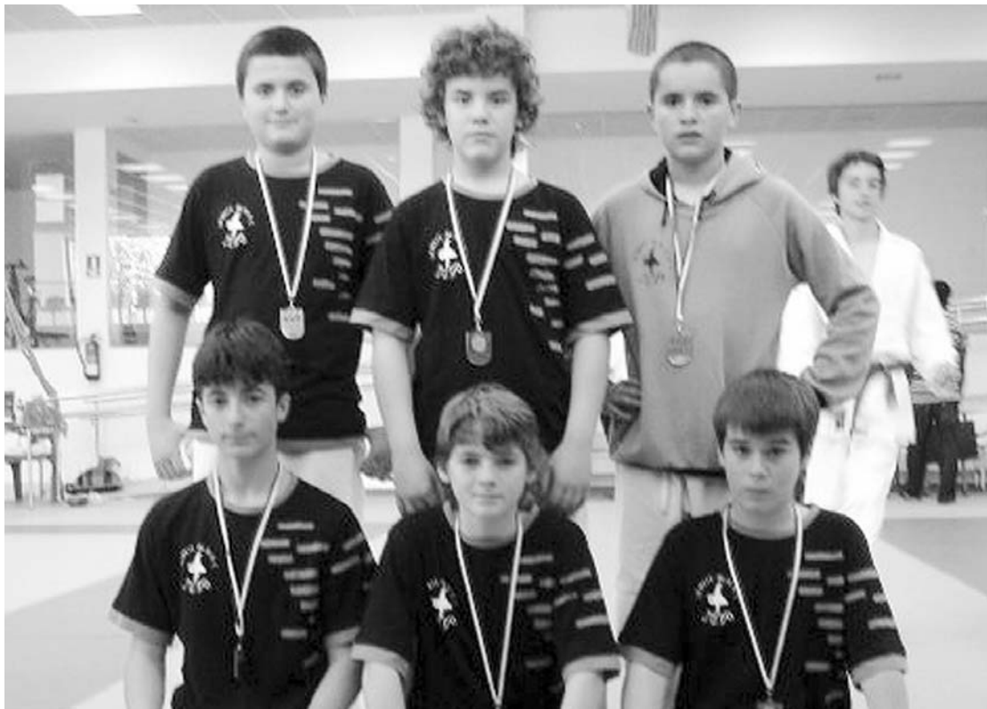
Lasarte-Oria Kirol Elkarte judoka gazteak Anoetan (Donostian) ospatu zen Gipuzkoako Txapelketan egindako argazkian.