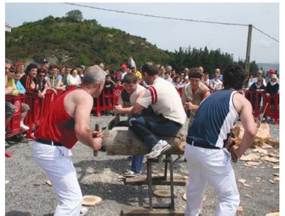
Bertsolariek eta kirolariek saio ederra egin zuten.