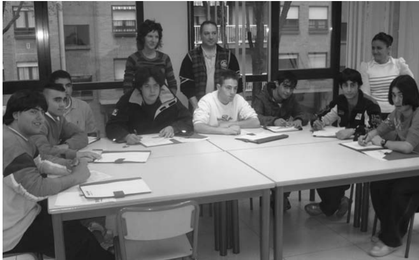
1998. urteetik egin ohi dira horrelako programak herrian.

Apirilaren 28an hasi zen gizarteratzeko arazoak dituzten gazteei zuzendutako ikastaroen bigarren fasea. Kurtsoa lanerako heziketa proiektua da eta gizarte heziketa programa baten parte diren zortzi gazteei zuzenduta dago. Helburu nagusia 17 eta 22 urte bitarteko gazte hauek lan munduan txertatzea da eta horretarako hiru dira betebeharreko xedeak. Lehenengoa gazteak motibatzea, lan mundura gogotsu sartu daitezkeen, bigarrena gazteek trebetasun, gaitasunak eta jarrera egokia hartzea eta hirugarrena lan munduaren ezaugarriak ezagutzeta bertan bakarrik moldatzen ikasteko. Helburu guztiak parte hartzaileek lan munduan murgildu eta bertan bakarrik ibiltzen ikasi dezaten finkatu dira. Lasate-Oriako gizarte zerbitzuak departamentuak aurrera daraman proiektu hau lau fazetan banatzen da, bi lan-heziketarako eta beste bi lanean hasateko. Lehenengoa fasea